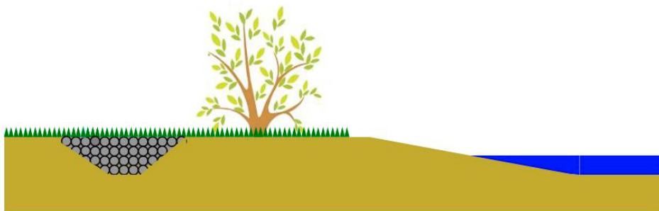
Rysunek 2. „Śpiące” umocnienia brzegowe rzeki Izary Figure 2. „Slipping” bank protection structure of the Isar River

W wybranych miejscach usunięto umocnienia w celu zapewnienia rzece możliwości swobodnego kształtowania linii brzegowej. Ukształtowano tzw. brzegi rozwojowe: między wałami przeciwpowodziowymi a korytem utworzono rowy o szerokości 1,5–2 m wypełnione materiałem kamiennym. Rowy te, określane jako „śpiące umocnienia”, stanowią granicę, do której rzeka może swobodnie erodować i kształtować swoje brzegi. W ten sposób stworzono Izarze przestrzeń do aktywności morfodynamicznej, eliminując ryzyko nadmiernej erozji brzegów (rys. 2).