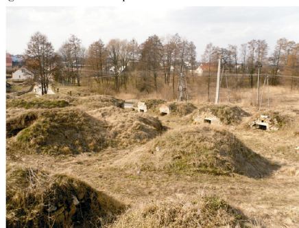
Rysunek 21. Widok piwnic. Figure 21. Cellars landscape. Fot. 2010