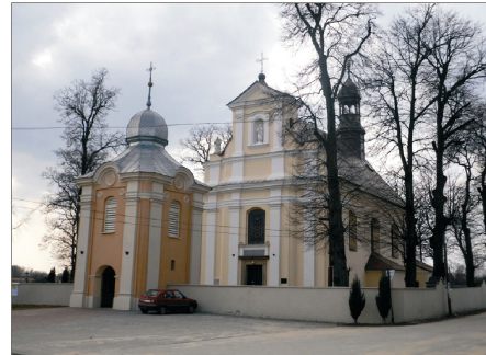
Rysunek 4. Pierzchnica - kościół. Figure 4. Pierzchnica - church. Fot. 2010 r.