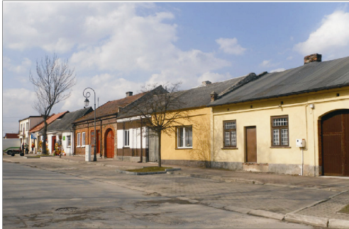
Rysunek 3. Pierzchnica - rynek. Figure 3. Pierzchnica - market square. Fot. 2010 r.