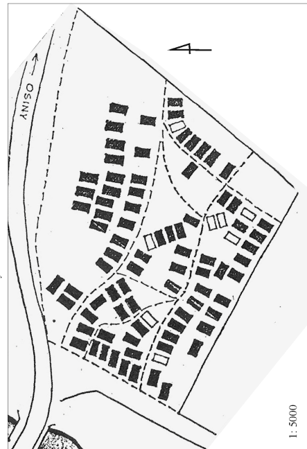
Rysunek 8. Plan piwnic, 1989 r. [rys. B. Paprocki, Z. Widański]