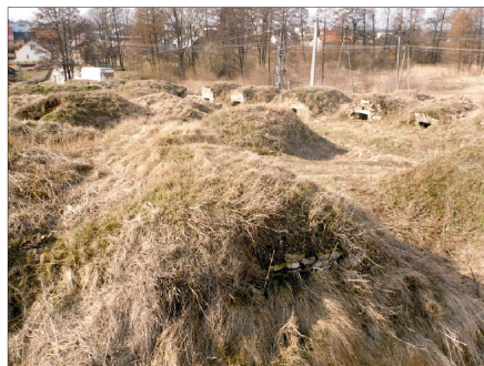
Rysunek 20. Widok piwnic. Figure 20. Cellars landscape. Fot. 2010