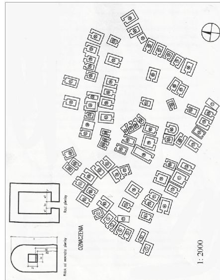
Rysunek 9. Plan piwnic, 1966 r. [rys. P. Kosowski]