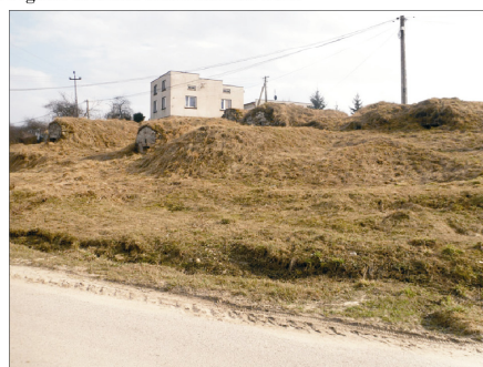
Rysunek 23. Góra Piwniczna. Figure 23. Cellar Mountain. Fot. 2010