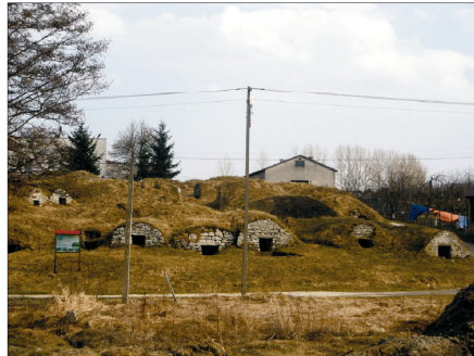
Rysunek 22. Góra Piwniczna. Figure 22. Cellar Mountain. Fot. 2010