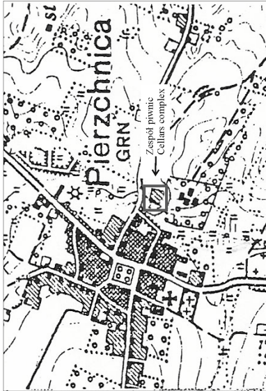
Rysunek 7. Fragment mapy topograficznej 1:25 000, lata 1980-1980. Starostwo Powiatowe w Kielcach