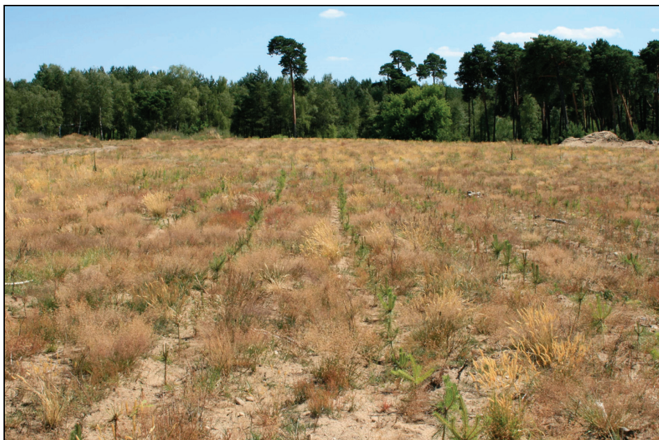
Fotografia 1. Zalesiony teren popoligonowy Bydgoszcz-Jachcice jesienią 2008 r.

cy [Rolbiecki R. in. 2007]. Na każdym poletku (wariancie) wysadzono 500 sadzonek sosny.