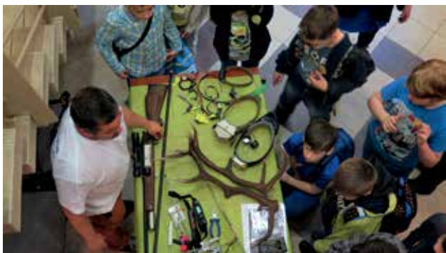
Ryc. 3. Duże zwierzęta.

Jeżeli nawet nie umieją teraz uświadomić sobie tego dokładnie, to mają przygotowanie i punkt wyjścia do dalszego rozwoju intelektualnego na kolejnych etapach edukacji. Pomieszczenia muzealne dały możliwość nowych rozwiązań organizacyjnych i kontaktu z okazami tak utrwalonymi, jak i żywymi, wchodzącymi w skład ekspozycji muzealnej. Nowoczesne muzeum przyrodnicze to nie tylko okazy zakonserwowane, ale i żywe organizmy w akwariach i wiwariach.