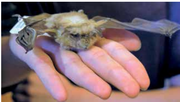
Ryc. 7. Jak badać niewidzialne? – tajemniczy świat nietoperzy.

przede wszystkim możliwość ukazania laikowi rzeczywistości niedostępnej na co dzień. W tym roku postawiono na komfort uczestników w ukierunkowanym poznawaniu przyrody, a więc mniej osób, ale nieprzypadkowych.