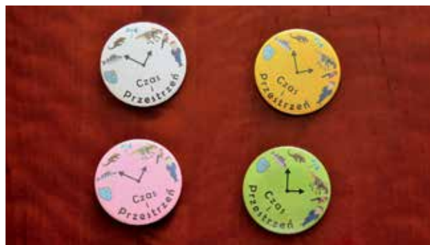
Ryc. 1. Przypinki z hasłem festiwalowym.

lowy został zorganizowany przez dwie krakowskie placówki Polskiej Akademii Nauk, Instytut Ochrony Przyrody oraz Instytut Systematyki i Ewolucji Zwierząt. Odbył się po raz pierwszy w przestrzeni Muzeum Przyrodniczego, a więc w przestrzeni ograniczonej, w przeciwieństwie do lat ubiegłych, kiedy program festiwalowy realizowany był w plenerach. Zajęcia i zwiedzanie prowadzone były przez pracowników naukowych obu placówek PAN (Instytut Ochrony Przyrody – koordynator: dr Kamil Najberek oraz Instytut Systematyki i Ewolucji Zwierząt – koordynator: dr Natalia Sawka-Gądek). Wnętrze Muzeum zostało podzielone na dwie części, ze stanowiskami obu placówek.