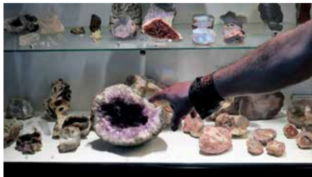
Ryc. 8. Co leży przy drodze? – O zbieraniu minerałów i skamieniałości.

Nauki nie powinien raczej wycofać się w inne bardziej spokojne miejsca, gdzie byłby wydarzeniem samym dla siebie, dla swojego oddziaływania na zainteresowanych, dla swojego wyjątkowego charakteru? Sąsiedztwo wszystkich innych sytuacji i wydarzeń