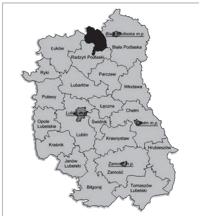
Rycina 3. Powiaty województwa lubelskiego (na czarno zaznaczono obszar zgłoszenia 10 przypadków różycy ludzi w latach 2005–2008 w zachodniej części powiatu Biała Podlaska)