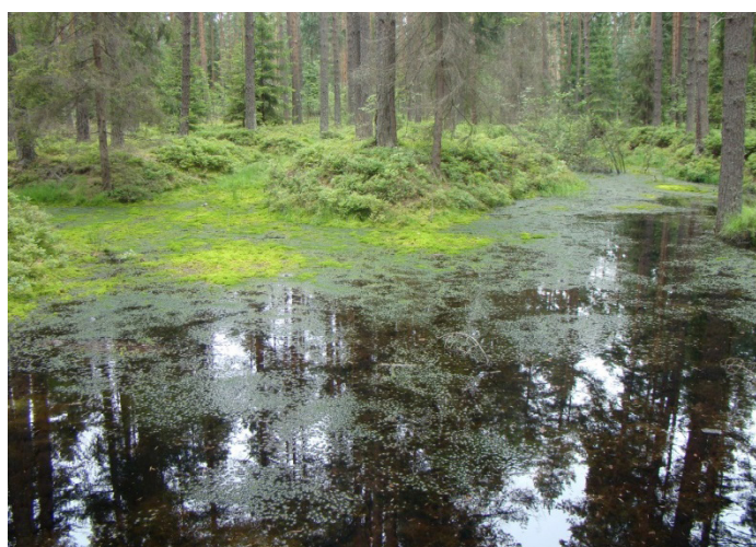
Figure 4. Peat bog in the valley Orawsko-Nowy Targ Rysunek 4. Torfowisko wysokie w Kotlinie Orawsko-Nowotarskiej

High peat bogs (figure 4.) constitute the most seldom met and at the same time the most precious type of peat bogs. They appear in drainless land cavities and their growth is straightly dependent on precipitation waters. For this reason the habitat of high peat bogs is acidic and strongly poor in nutritional substances. The content of flora is poor and extremely fragile to even slight breakages of habitats concerning above all moisture and fertility. Due to the hard habitat conditions and rate occurrence of this type of peak bogs caused mainly by anthropogenic factors a large part of the species of flora which build their plant communities are the rare species under protection (Stańko 2010).