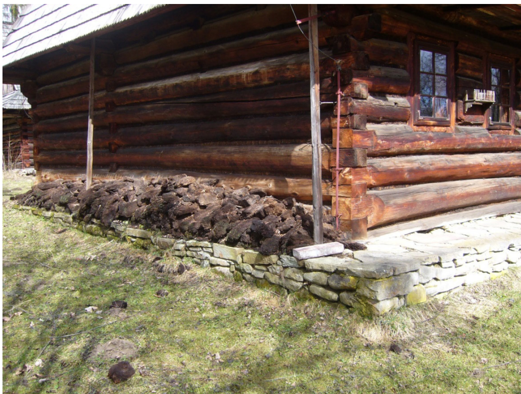
Figure 5. Museum - Orawa Ethnographic Park in Zubrzyca

Wielu turystów interesuje nie tylko przyroda torfowisk, ale i wydobywanie torfu. Podczas Czarnego Wesela, cyklicznej imprezy organizowanej przez muzeum w Klukach, można zapoznać się z prostymi metodami wydobywania i suszenia torfu z XIX wieku z okolic jezior Gardno i Łebsko ( http://muzeumkluki.pl ). O metodach wydobywania torfu na Orawie informuje natomiast Muzeum - Orawski Park Etnograficzny w Zubrzyca ( http://www.orawa.eu ).