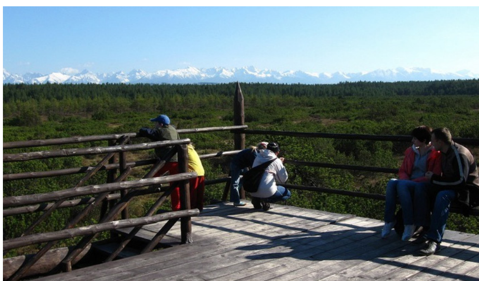
Figure 8. The observation platform overlooking the dome of peat bogs and Tatry Rysunek 8. Platforma widokowa z widokiem na kopułę torfowiska oraz Tatry

Rezerwat Bór na Czerwone stał się idealnym miejscem, w którym można zorganizować grę terenową. Z okazji 90-lecia utworzenia rezerwatu Nadleśnictwo Nowy Targ oraz Podhalańska Państwowa Wyższa Szkoła Zawodowa w Nowym Targu we współpracy z Regionalną Dyрекcją Ochrony Środowiska w Krakowie przygotowało imprezę plenerową o charakterze edukacyjnym. Wśród licznych atrakcji, konkursów, gier i zabaw zorganizowano marsz nordic walking „Z kijami przez torfy”, którego trasa prowadziła ścieżkami rezerwatu oraz drużynową grę terenową „Tropem Rosiczki”, którego przygotowania podjęli się uczniowie I LO im. Goszczyńskiego w Nowym Targu ( http://www.nowytag.krakow.lasy.gov.pl ) (rysunek 8).