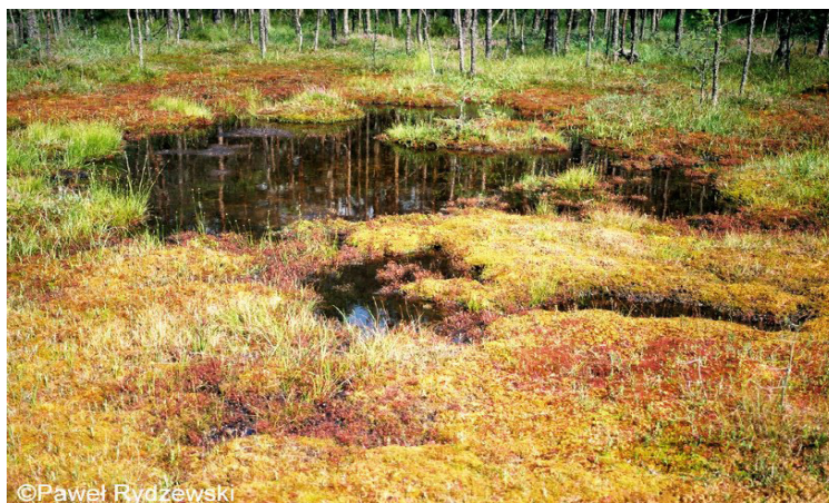
Figure 3. Transitional peat bog in Central Roztocze Rysunek 3. Torfowisko przejściowe na Roztoczu Środkowym

Transitional peat bogs (figure 3) are at the medium position between high and low peat bogs which is visible, above all, in the species composition of their flora. They often form themselves in the areas of dystrophic lakes, gradually overgrown by moor (top-down landing of water reservoir) or on the areas of high peat bogs (Koczur 2012).