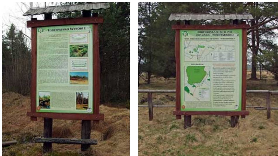
Figure 9. Educational boards along the path of nature Rysunek 9. Tablice edukacyjne na ścieżce przyrodniczej

Drugim przykładem dobrego zagospodarowania turystycznego jest Torfowisko Baligówka, które jeszcze nie tak dawno było eksploatowane. Ścieżka przyrodnicza „Torfowisko Baligówka” powstała z inicjatywy uczniów Gimnazjum w Czarnym Dunajcu i była pierwszym zadaniem, które zostało zrealizowane przez „Małopolską Koalicję na rzecz Ochrony Bocianów i ich siedlisk.” Głównym celem była edukacja młodzieży poprzez prezentację walorów środowiska torfowiskowego, niespotykanych na co dzień roślin i zwierząt. Rezultaty przeszły najśmielsze oczekiwania wszystkich zaangażowanych w projekt (rysunek 9).