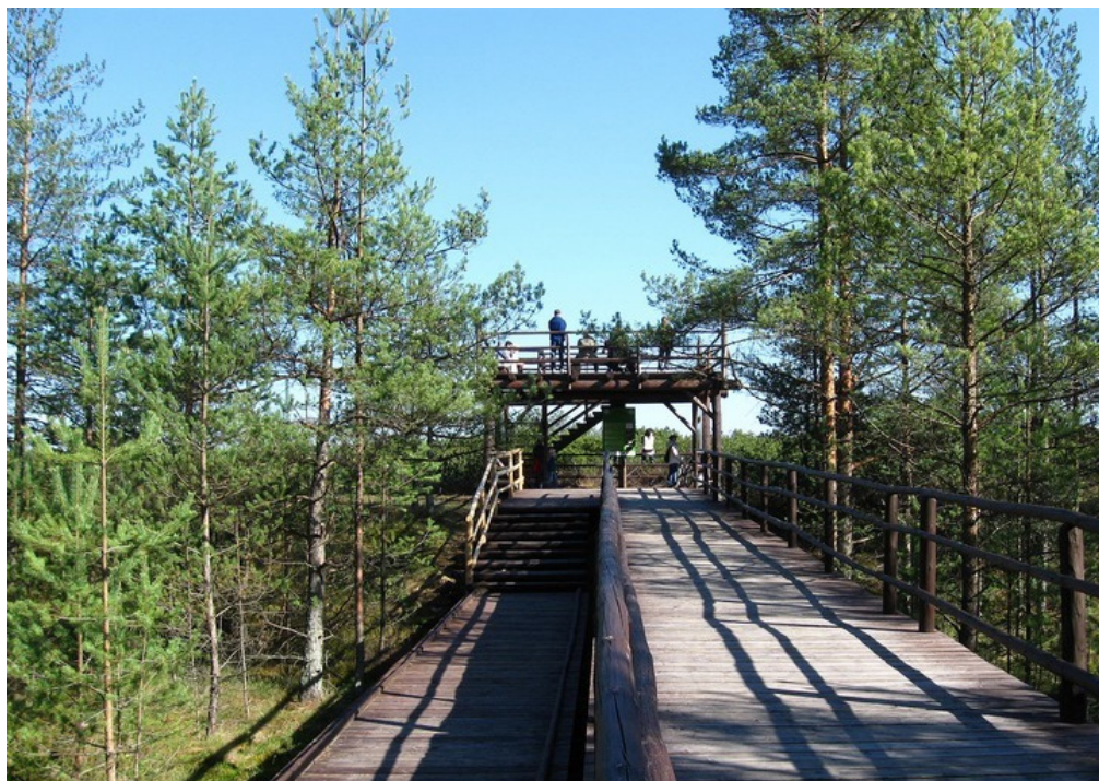
Figure 6. Viewing platform