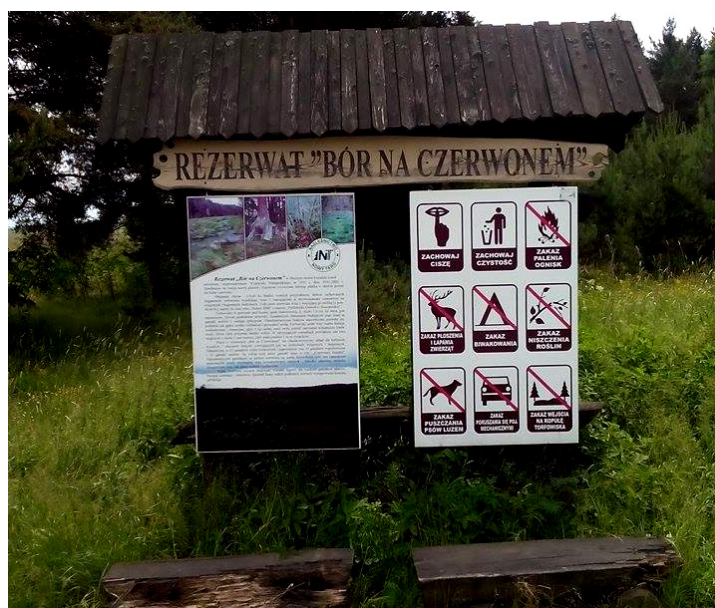
Figure 7. Information boards Rysunek 7. Tablice informacyjne

Bór upon Czerwone Reserve became a perfect place for organizing a field game. On the occasion of the 90th anniversary of the founding of the reserve State Forest District Nowy Targ and the Podhale State School of Higher Professional Education in Nowy Targ in cooperation with the Regional Directorate of Environmental Protection in Kraków elaborated an open-air event of educational character. Among numerous attractions, contests, games and plays a Nordic walking march „Z kijami przez torfy” was organized the route of which led through the trails of the reserve. Apart from that a field game “Tropem Rosiczki” was organized the preparation of which was carried out by the pupils of the Goszczyński High School no. 1 in Nowy Targ ( http://www.nowytag.krakow.lasy.gov.pl ) (figure 8).