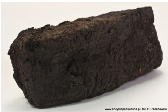
Figure 1. Peat