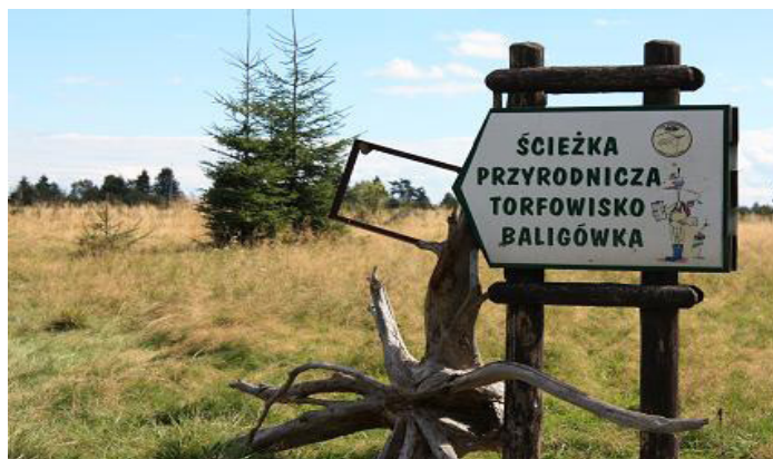
Figure 10. The arrows indicate the direction of nature path Rysunek 10. Strzałki wskazujące kierunek ścieżki przyrodniczej

Sukces ten zawdzięcza się utworzeniu między innymi 13 tablic edukacyjnych, 10 drewnianych mostków i miejsce wypoczynkowe, w którym znajduje się 4 stoliki, 8 ławek pod zadaszeniem, dwa stojaki rowerowe (www.fwie.eco.pl). Trasa prowadzi przez najciekawsze miejsca na torfowisku, objaśnione dodatkowo tablicami informacyjnymi o tematyce związanej z torfowiskami, flora, fauną i ochroną tych obszarów (rysunek 10).