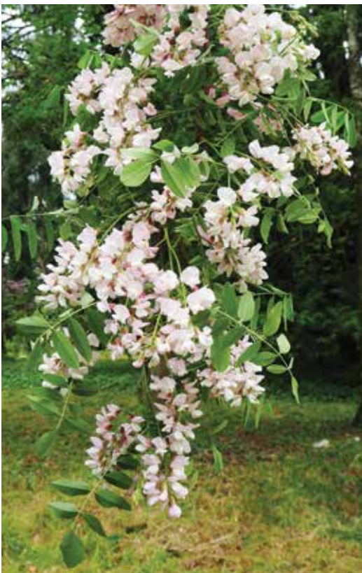
Ryc. 9C. Pęd gęsto pokryty kwiatostanami. Fig. 9C. Stem densely covered with inflorescences.