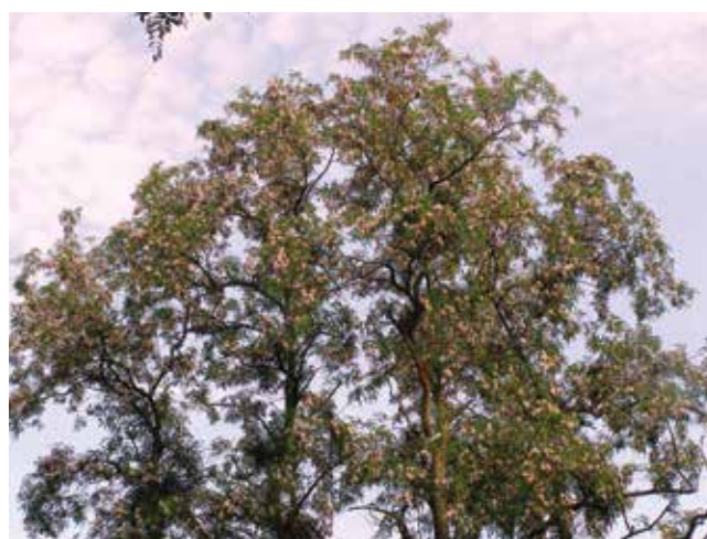
Ryc. 3B. Wierzchołek tego drzewa.

Fig. 3A. An old, four-stemmed specimen of Robinia 'Decaisneana' (Ambigua Group) in the Kórnik Arboretum.