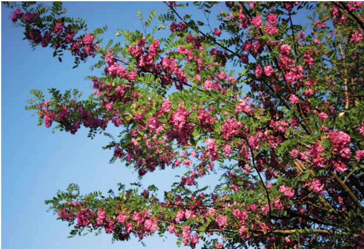
Ryc. 7A. Robinia 'Purple Robe' (Grupa Margarettae) – fragment korony. Szkółki w Końskowoli.

1933). Jak podaje autor: Jest to zupełnie nowa odmiana otrzymana w szkółkach naszych, z nasion R. kelseyi. Wyróżnia się od gatunku typowego obfitszą ilością kwiatostanów, większą ilością kwiatów w tychże, a także układem pędów i gałęzi, które posiadają charakter płaczący. Robinia ta, zwana przez Wróblewskiego grochownikiem Kelseya, szybko zniknęła z uprawy. Ze starych planów nasadzeń wynika, że dwa okazy tej odmiany rosły po wojnie w arboretum w Kórniku, jednak nie zachowały się do dziś. Roślina o powyższej nazwie, prawdopodobnie sprowadzona z Kórnika, rosła do połowy ubiegłego wieku także w Arboretum Arnolda w Stanach Zjednoczonych, jednak w roku 1954, wraz