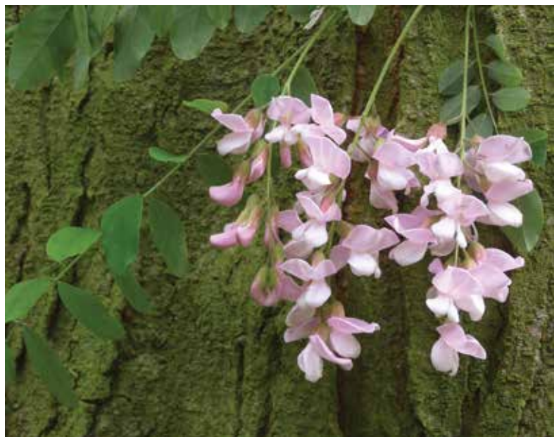
Ryc. 9D. Kwiatostany tego mieszańca. Fig. 9D. Inflorescences of this hybrid.

Wokół pnia, na odległość około 5 metrów, wyrastają oliwkowobrazowe, gęsto szczytniasto owłosione odrosty korzeniowe o dość silnych sztydłowych cierniach. Ogólnie mieszaniec ten wydaje się morfologicznie bardzo bliski typowej formie R. ×margarettae . Jest też podobny do kultywaru 'Hillieri', ale ma znacznie szersze listki, zwłaszcza na długopędach i pędach odrostowych.