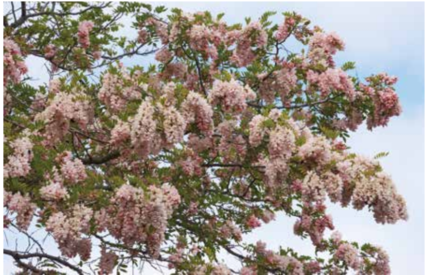
Ryc. 3D. Robinia 'Decaisneana'. Fragment korony.