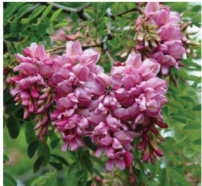
Ryc. 1. Robinia ‘Bella Rosea’ (Grupa Ambigua). W pierwszym, oryginalnym opisie tego kultywaru zabarwienie jego kwiatów nie zostało przez Nicholsona (1887) określone, jednak tradycyjnie za Vossem (1896) przyjmuje się, że są one ciemnoróżowoczerwone (Fot. M. Dziurla).

Ze wspomnianych wcześniej powodów identyfikacja szeregu kultywarów robinii okazała się dość trudna. Kultywarem najwcześniej wyróżnionym spośród różowokwiatowych mieszańców robinii jest Robinia ×ambigua ‘Bella Rosea’, opisana pierwotnie jako R. bella-rosea G. Nicholson (Nicholson 1887; ss. 309–310). Od bliskiej R. viscosa różni ją miał brak charakterystycznych dla tego gatunku lepkich gruczołków na pędach, w rzeczywistości jednak nie była to jedyna cecha wyróżniająca nowo opisaną roślinę. Nicholson (l.c.) nic nie pisze jej kwiatach, ale nadana tej robinii nazwa – „bella-rosea” pozwala przypuszczać, że w trakcie kwitnienia była ona bardziej efektowna niż typowa R. viscosa . Potwierdza to opis opublikowany kilka lat później przez Vossa (Voss 1896), z którego wynika, że w porównaniu z robiniejką kwiaty R. bella-rosea są „piękniej różowoczerwono” zabarwione (...schöner rosenrot).