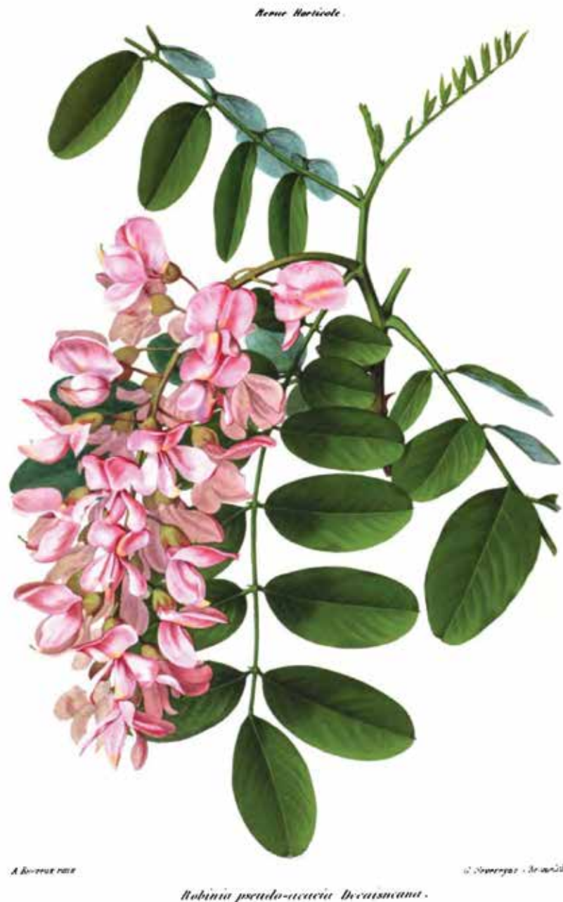
Ryc. 2. Pierwsza ilustracja Robinia ×ambigua ‘Decaisneana’, opisanej przez Carrière’a (1863) jako „ Robinia pseudoacacia var. Decaisneana ”. Rycina ta powinna być traktowana jako wzorzec kultywaru.

Inną starą odmianą uprawną, o podobnym pochodzeniu jak ‘Bella Rosea’, jest Robinia ×ambigua ‘Decaisneana’. Wyhodowana została w szkółkach w Manosque w południowej Francji, a opisana przez Carrière’a pod nazwą R. pseudoacacia var. Decaisneana (Carrière 1863). Z krótkiej notatki, pełnej zachwytyw autora nad różowymi kwiatami tej odmiany, wynika, że pod względem pokroju nie różniła się ona od robinii akacyjowej. Towarzysząca tekstowi kolorowa ilustracja przedstawia roślinę o długich, ± zwisających kwiatostanach i kubeczkowatych, płytko ząbkowanych kielichach (ryc. 2). Zakładając, że plansza dokładnie oddaje szczegóły