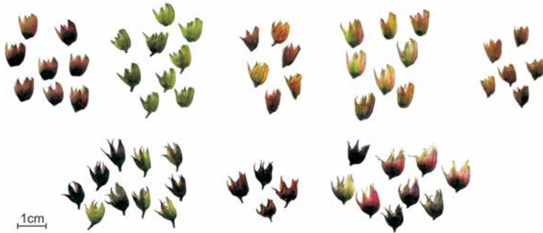
Ryc. 10. Kielichy różnych mieszańców różowokwiatowych robinii. Rząd górny – Grupa Ambigua; rząd dolny – Grupa Margarettae. U form należących do drugiej grupy ząbki obu warg kielicha są ościsto zastrzone – cecha oddziedziczona po Robinia hispida.

Poniżej zaproponowano utworzenie dwóch takich formalnych grup: jednej łączącej kultywary wyselekcjonowane z kręgu Robinia ×ambigua i R. ×holdtii , a drugiej obejmującej odmiany mieszczące się w zakresie zmienności R. ×margarettae . Te dwa kompleksy są łatwe do wyróżnienia głównie na podstawie budowy kielicha (ryc. 10), a przy pewnej wprawie można je rozróżnić także po cechach trudniejszych do sprezywania, takich jak wielkość kwiatów i pokrój roślin.