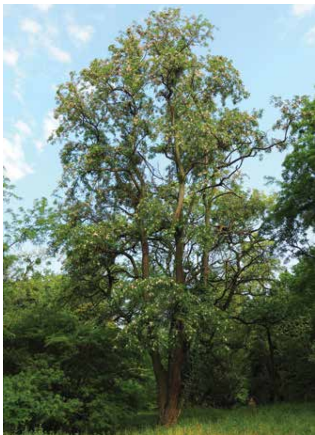
Ryc. 3A. Stary, czteropniowy okaz Robinia 'Decaisneana' (Grupa Ambigua) w Arboretum Kórnickim.

tywarów. Ze starych planów Arboretum Kórnickiego wynika, że jeszcze w latach pięćdziesiątych ubiegłego wieku na sekcji XXVIII rosły trzy okazy tej odmiany posadzone w 1925 r.; już tylko dwa z nich (pod nazwą R. pseudoacacia 'Decaisneana') odnotowano w opublikowanym w roku 1974 zestawieniu kórnickich drzew i krzewów (Bojarczuk, Bojarczuk l.c.). Dokonany ostatnio przegląd miejscowej kolekcji rodzaju Robinia wykazał, że na wspomnianej sekcji zachował się tylko jeden stary osobnik odpowiadający w pełni cechom robinii Decaisne'a. Jest to czteropniowe drzewo, wysokości około 10 m, ogólnie podobne do robinii akacjowej, od której różni się jedynie płyciej bruzdowaną korą, różową barwą kwiatów i nieco ogruczolonymi kielichami i osiami kwiatostanów. Pąki i nowo rozwinięte kwiaty są dość intensywnie różowo zabarwione, natomiast kwiaty w pełni rozwinięte są nieco bledsze, jasnorożowe