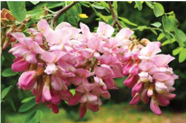
Ryc. 3E. Pąki i nowo rozwinięte kwiaty Robinia 'Decaisneana' są ciemniej zabarwione.