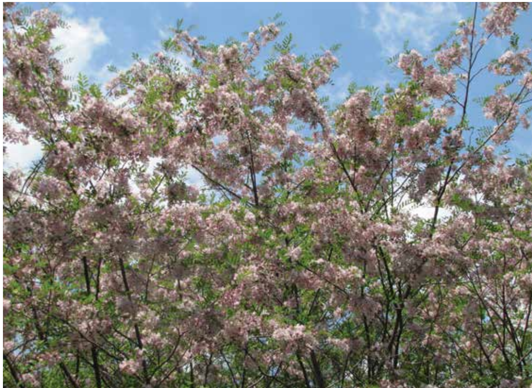
Ryc. 5A. Robinia ‘Hillieri’ (Grupa Margarettae). Ogród Botaniczny w Berlinie-Dahlem. Fragment korony (Fot. P. Konieczko).

Innym, obecnie znacznie bardziej rozpowszechnionym w uprawie kultywarem z kręgu R. ×margarettae , jest ‘Pink Cascade’. Wyróżnia się obfitym kwitnieniem i stosunkowo dużymi, różowymi kwiatami, zebranymi w dość gęste grona (ryc. 6A, B). Od Robinia ‘Hillieri’, poza barwą kwiatów, różni się szerszymi listkami, co wskazuje na to, że kultywar ten może być mieszańcem R. pseudoacacia z typową, szerokolistkową formą R. hispida . Wyhodowany został w Stanach Zjednoczonych w 1934 r. (Krüssmann 1962), ale już pod koniec lat pięćdziesiątych XX w. w szkółkach amerykańskich był oferowany pod nazwą handlową CASQUE ROUGE (Spencer 2002).