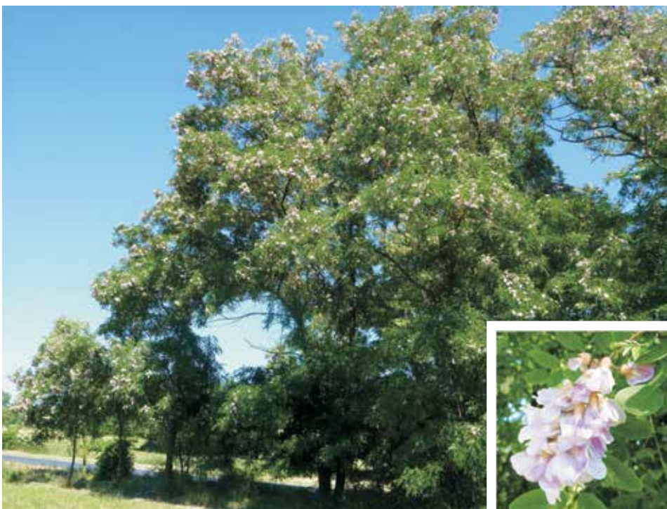
Ryc. 4. Różowokwiatowa robinia zadomowiona na skraju lasu, koło miejscowości Mełpin; wydaje się morfologicznie identyczna z Robinia 'Decaisneana'. W ramce jej kwiatostan (Fot. M. Sękiewicz).

Robinia 'Decaisneana' nie jest szerzej znaną odmianą, po części dlatego, że wyróżnia się wyłącznie w okresie kwitnienia. Taki obficie kwitnący jej okaz został ostatnio „rozpoznany” w starej zieleni miejskiej Śremu (inf. K. i M. Sękiewiczowie), niewykluczone więc, że kultywar ten zostanie odnotowany także w innych miejscach. Wśród zadomowionych poza uprawą robinii z kręgu R. ×ambigua pojawiają się niekiedy podobne do 'Decaisneana' osobniki, ale rzadko bywa tak, że można je bez wahania uznać za w pełni z tą odmianą tożsame. Niektóre z nich nie budzą jednak większych wątpliwości, jak na przykład rosnące na opisanym ostatnio stanowisku w Tucznie (Zieliński i in. 2015, ryc. 16C) oraz grupa drzew zaobserwowana wiosną tego roku na skraju lasu, na południe od miejscowości Mełpin (52°00'14" N, 17°01'13" E; obs. M. Sękiewicz; ryc. 4).