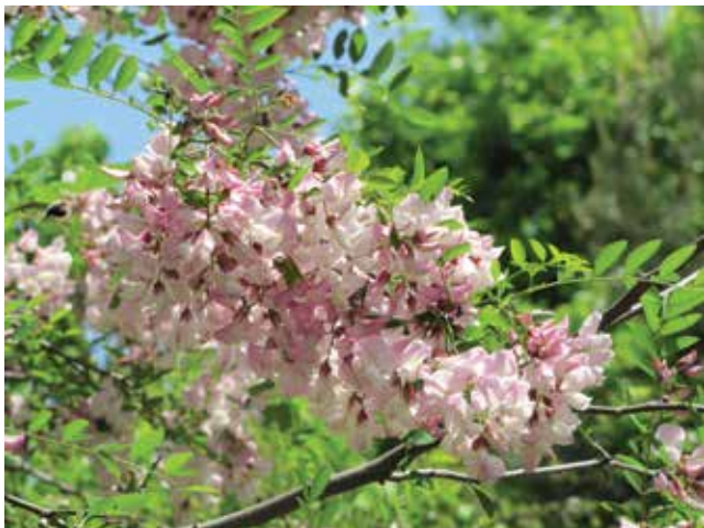
Ryc. 5B. Kwiatostany Robinia ‘Hillieri’. Fragment korony. Ogród Botaniczny w Berlinie-Dahlem (Fot. P. Konieczko).

Fig. 5A. Robinia ‘Hillieri’ (Margarettae Group). The Botanical Garden in Berlin-Dahlem. Fragment of the crown (Photo P. Konieczko).