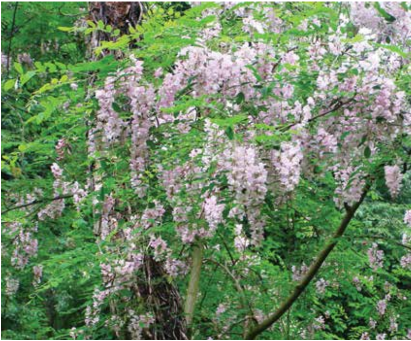
Ryc. 9B. Fragment korony tego mieszańca. Fig. 9B. Fragment of the crown of this hybrid..