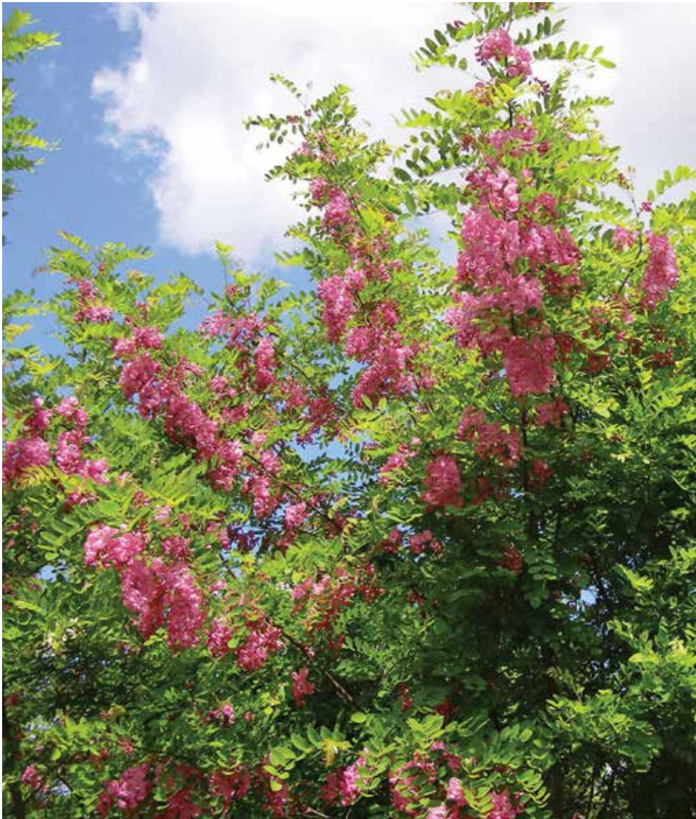
Ryc. 6A. Robinia 'Pink Cascade' (Grupa Margarettae ). Fragment korony. Szkołki Instytutu Dendrologii PAN w Kórniku.