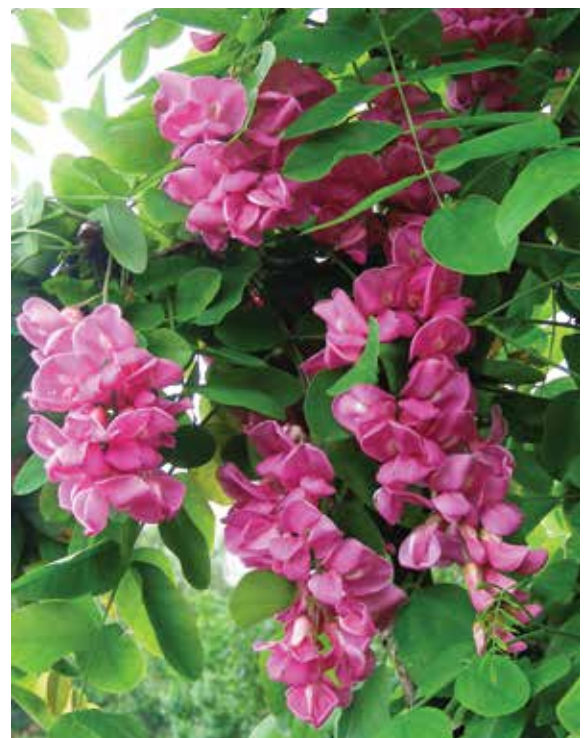
Ryc. 6B. Kwiatostany Robinia 'Pink Cascade'. Szkołki Instytutu Dendrologii PAN w Kórniku (Fot. J. Zieliński).

'Pink Cascade' nie jest jedynym kultywarem z kręgu Robinia × margarettae , charakteryzującym się dużymi, różowymi kwiatami. Już z pobieżnego przeglądu internetowych ofert, zwłaszcza szkólek amerykańskich, oraz z różnego rodzaju opracowań dendrologicznych wynika, że opisano z czasem co najmniej kilka kultywarów bardzo podobnych do powyższej robinii, jak na przykład 'Flemor', 'Idahoensis', 'Purple Crown', 'Purple Robe', 'Red Cascade'. Sądząc po ich opisach i fotografiach można z dużym prawdopodobieństwem przypuszczać, że przynajmniej większość z nich to synonimy Robinia 'Pink Cascade' lub formy morfologicznie