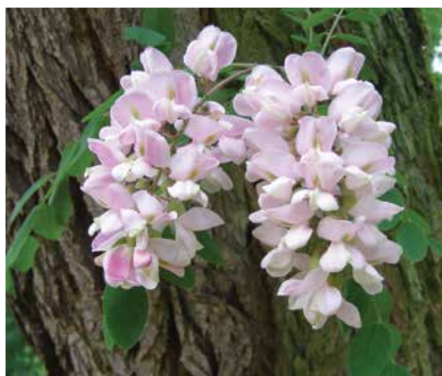
Ryc. 3C. W pełni rozwinięte kwiaty tego kultywaru są jasnorożowe.

Fig. 3B. The top of this tree.