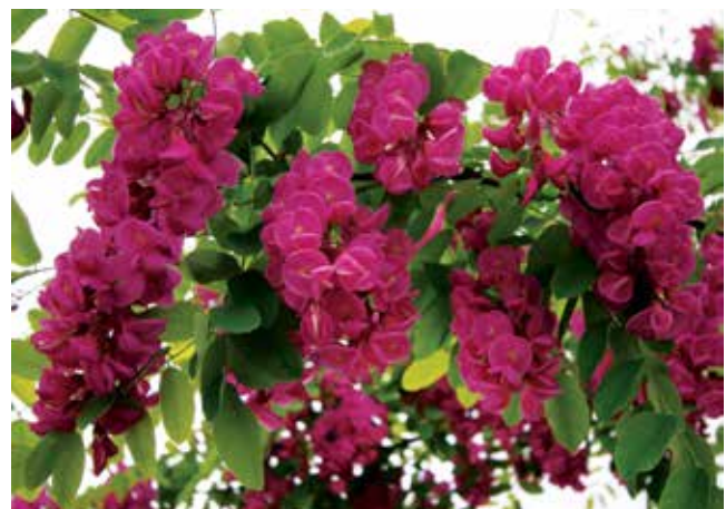
Ryc. 7B. Kwiatostany Robinia 'Purple Robe'. Szkółki w Końskowoli.