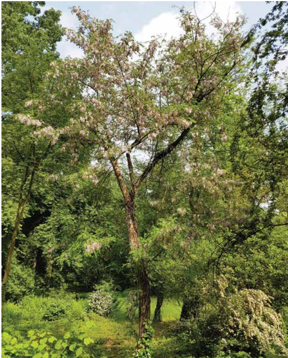
Ryc. 9A. Mieszanećowa robinia ( Robinia hispida × R. pseudoacacia ) wyhodowana w Arboretum Kórnickim z nasion otrzymanych z Arboretum des Barres pod nazwą R. fertilis (= R. viscosa var. fertilis ). Morfologicznie bardzo bliska typowej notomorfie R. ×margarettae.

Inny mieszańiec Robinia hispida i R. pseudoacacia pojawił się przypadkowo w Arboretum Kórnickim pod koniec lat pięćdziesiątych ubiegłego stulecia. Został otrzymany z nasion R. hispida var. fertilis (Ashe) Clausen, nadesłanych z Arboretum des Barres we Francji pod nazwą R. fertilis Ashe (Bojarczuk, Bojarczuk 1974). Obecnie rosnące w Arboretum drzewko (sekcja XIX; nr inw. 11126) ma wysokość około 5 m, jest nieco zdeformowane przez porastający je do niedawna bluszcz. Ma średniej wielkości kwiaty koloru lilarów, zebrane w dość luźne, przypominające wistarię kwiatostany; kielichy kwiatów z wąskimi, ościstymi ząbkami, przysadki wąskie, szybko odpadające, a strąki gęsto pokryte gruczołkami na szczeciniastych trzoneczkach (ryc. 9A–D).