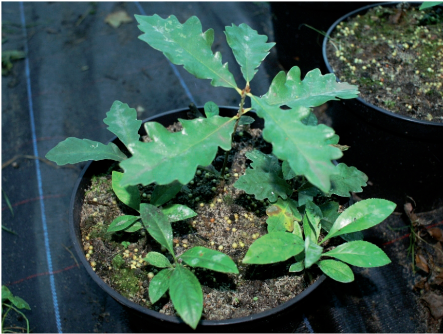
Fot. 1. Dąb rosnący w interakcji z czeremchą w warunkach 5% światła pełnego Photo 1. Oak growing in interaction with black cherry in 5% level of light