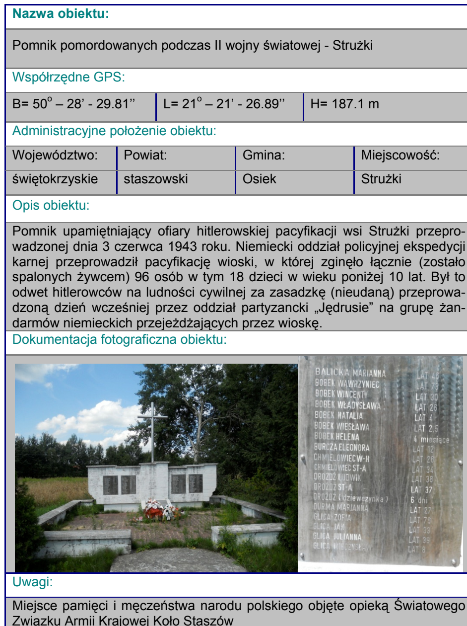
Rysunek 4. Karta obiektu „Pomnik pomordowanych podczas II wojny światowej – Strużki”