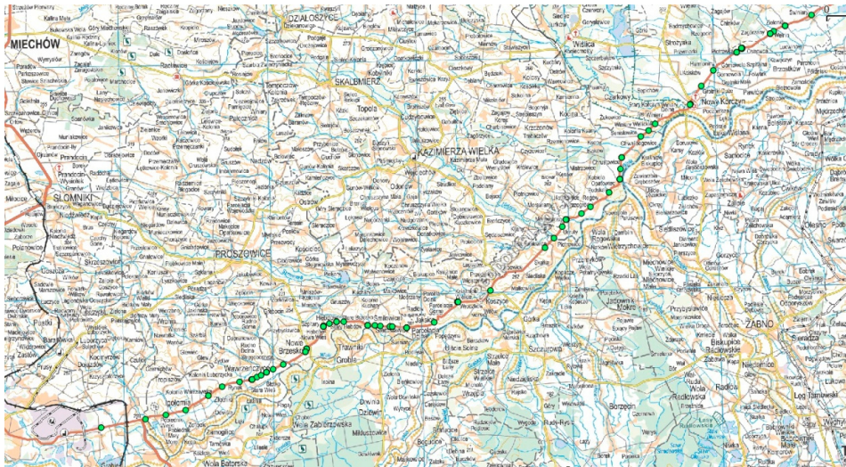
Rysunek 2. Zestawienie punktowe obiektów na warstwie WMS Figure 2. Overview point objects in a layer WMS