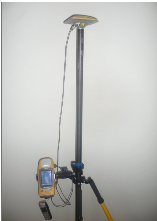
Rysunek 1. Zestaw pomiarowy Topcon GMS-2 z anteną zewnętrzną PG-A1 i modemem GSM