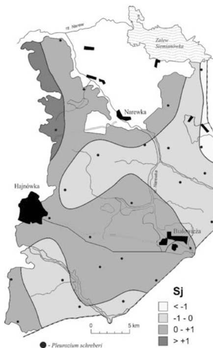
Rys. 2. Rozkład przestrzenny indeksu zawartości metali (Sj) w mchu Pleurozium schreberi w Puszczy Białowieżskiej w latach 1994-2009

Fig. 1. Trend of change in heavy metal content index Sj in moss Pleurozium schreberi in the Białowieża Primeval Forest in the years 1994-2009