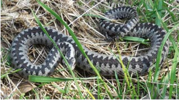
Ryc. 2. Żmija zygzakowata (Viperidae) jedyny jadowity gatunek węży występujący w Polsce.

Węże dzielą się na dwie odrębne i w znacznym stopniu różniące się od siebie grupy (Ryc. 3): Scolecophidia (5 rodzin) i Alethinophidia (tzw. węże właściwe, 20 rodzin). Przedstawiciele Scolecophidia są uważani za pierwotniejszych, ich anatomia i tryb