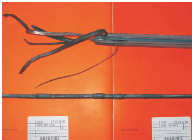
Rys. 6. Uszkodzony wał napędowy z osłoną Fig. 6. Damaged drive shaft together with its casing

Na skutek uszkodzenia przekładni kątovej dość często następowało też uszkodzenie wału napędowego, wraz z jego ułożyskowaniem (rys. 6). Częste były także uszkodzenia układu napędowego wynikające z niewłaściwego sposobu pracy urządzeniem bądź zwykłego przypadku, o jaki nie trudno, gdy pracuje się w przestrzeni o ograniczonej widoczności. Przykładem mogą być awarie wynikające z uderzenia narzędziem tnącym w kamień.