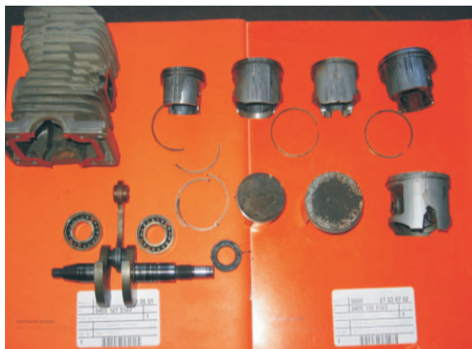
Rys. 3. Uszkodzone elementy układu korbowo-tłokowego w wyniku zatarcia silnika

Fig. 2. Dirty and damaged air-filters