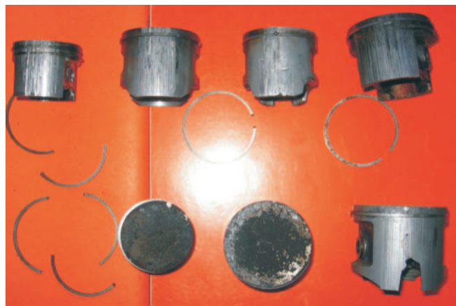
Rys. 4. Uszkodzone (zatarłe) tłoki z pierścieniami

żności od charakteru wykonywanej pracy - żyłkowa głowica tnąca, tarcza tnąca, zespół tnący w przypadku podkrzesywarek. Charakterystyczną cechą grupy wykaszarek spalinowych jest także brak układu smarowania narzędzia tnącego, który w przypadku pilarek spalinowych wykazywał stosunkowo dużą awaryjność, oraz odmienny układ amortyzujący, który w przypadku narzędzi profesjonalnych, składa się dodatkowo z amortyzatorów zamocowanych przy trzonie wysięgnika.