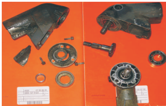
Rys. 5. Uszkodzenie przekładni kątowej

Na układ napędowy wykaszarek i podkrzesywarek, oprócz silnika spalinowego oraz sprzęgła odśrodkowego, które są wspólne także dla pilarek, składa się trzon wysięgnika, uchwyt sterujący, wysięgnik, wał napędowy, tuleja gumowa z łożyskiem igiełkowym, łożyska wału napędowego, przekładnia łożyskowa oraz narzędzie tnące.