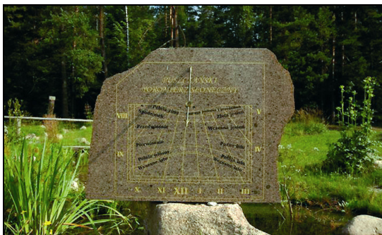
Fot. 2. Puszczański poromierz słoneczny Photo 2. Forest season sundial