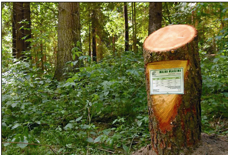
Fot. 7. Element tryby ziołowej

Ta niepowtarzalna kolekcja wzbudza żywe zainteresowanie odwiedzających Silvarium, stając się klasycznym węzłem, który następnie oprowadzający obudowuje wiedzą o środowisku przyrodniczo-leśnym nie pomijając przy tym aspektów tradycji i kultury regionu.