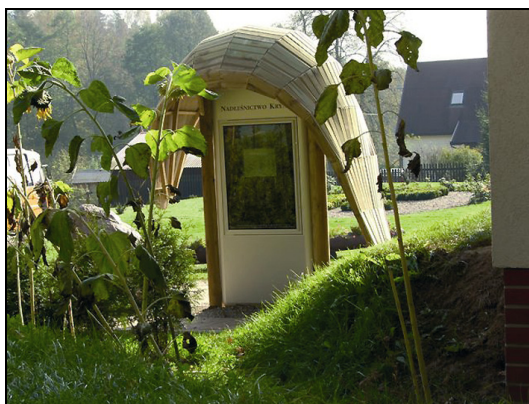
Fot. 1. „Silvarium” – kiosk multimedialny Photo 1. “Silvarium” – multimedia quiosque