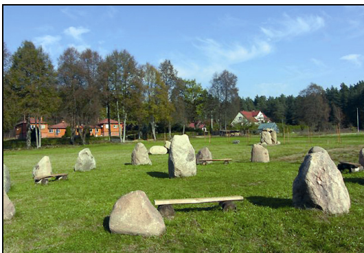
Fot. 5. Park Megalitowy w Poczopku Photo 5. Megalith Park in Poczopek