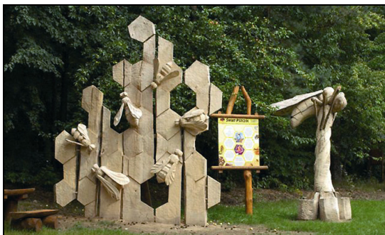
Fot. 4. Pszczoła jako fenomen przyrody – rzeźba w przestrzeni Photo 4. Bee as a nature phenomenon – sculpture in space