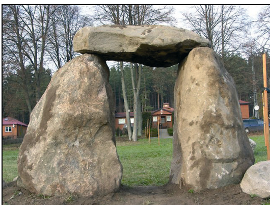
Fot. 6. Kamienna Brama w Parku Megalitowym Photo 6. Stone Gate in Megalith Park