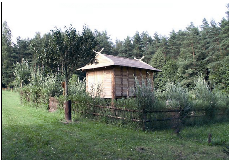
Fot. 8. Prawdopodobnie jedyna w Polsce – „Ptasia chata” Photo 8. Probably the only one in Poland – “Birds cabin”

Unikalny w Polsce, domek ze szklanymi budkami lęgowymi, zawsze wywołuje ogromne zainteresowanie. Wychowankowie Discovery, Planet i innych kanałów przyrodniczych TV, ze zdumieniem konstatują, że coś podobnego mają obok, że bliższe poznanie świata przyrody nie musi wiązać się z fotelem przed telewizorem, że to właśnie leśnicy prezentują im ten przekaz. W starannie zaciemnionym pomieszczeniu zamontowano dziewięć przejrzystych, szklanych skrzynek lęgowych, połączonych zróżnicowanymi wielkością otworami ze światem zewnętrznym. W ciszy, w ciemności można tu obserwować misterium gniazdowania, wychowywania i wyprowadzania lęgów.