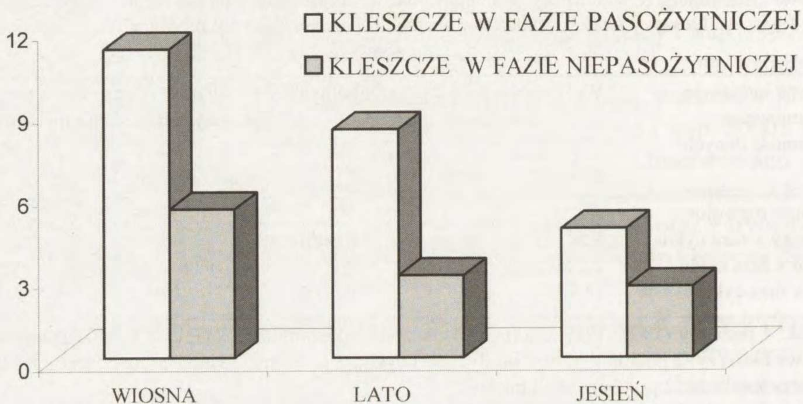
Rys. 2. Porównanie zakażenia krętkami Borrelia burgdorferi s.l. kleszczy Ixodes ricinus pasożytujących na gryzoniach (faza pasożytnicza) i zebranych w środowisku (faza niepasożytnicza)

Siński i Pawełczyk 1999). Jest to bardzo istotne z medycznego i epidemiologicznego punktu widzenia, ponieważ to samice głównie pasożytują na ludziach. Od wiosny do jesieni obserwowano spadek Borrelia pozytywnych kleszczy z 11,7% do 2,6% (Rys. 1). Podobny rozkład zarażenia opisali Rijpkema i wsp. (1994) oraz Gern i wsp. (1999). Różnice dotyczące odsetka zakażenia przez krętki poszczególnych stadiów rozwojowych kleszczy wskazują na lokalny charakter występowania zakażenia krętkami B. burgdorferi s.l. w badanym środowisku.