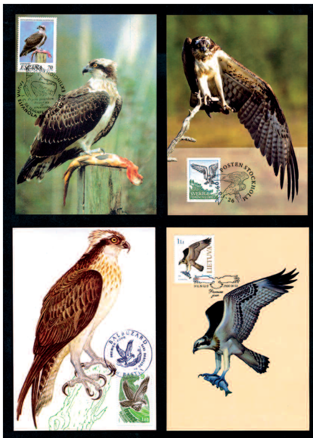
Ryc. 2. Karty maksimum z rybołowem z Hiszpanii, Szwecji, Francji i Litwy

„rybołów”. W tworzeniu kolekcji pomocne są katalogi, szczególnie „Collect Birds on stamps. A Stanley Gibbons, thematic catalogue”. Katalog ten wydawany od 1983 roku doczekał się już pięciu wydań, ostatnie ukazało się w 2003 r. Wzrost liczby nowych znaczków przypada na połowę ubiegłego stulecia. Powstanie wielu nowych państw zaowocowało burzliwym rozwojem kolekcjonerstwa. Po okresie dominowania na znaczkach przywódców politycznych, tematów rocznicowych, coraz więcej dostrzegany jest problem ochrony środowiska. Ptaki są wiodącym motywem na wielu znaczkach. Na przykład w latach 1990-1995 pojawiło się około 2500 znaczków z ptakami oraz aż 4700 w latach 1996-2002 (Gibbons 2003). Niektóre gatunki ptaków występujące na kilku kontynentach są licznie wykorzystywane na znaczkach. Na przykład sokół wędrowny Falco peregrinus widnieje na 211 znaczkach. Do maja 2009 szacunkowo wydano na świecie 26 000 znaczków przedstawiających 3420 gatunków ptaków. ( http://www.birdtheme.org/statistics.html ). Uzupełnieniem kolekcji są całostki filatelistyczne w tym koperty pierwszego dnia obiegu FDC ( First Day Cover ), maxi-karty z wizerunkami ptaków oraz okolicznościowe stemple pocztowe. Przeglądowe artykuły o ptakach szponiastych na znaczkach zawarto w pracach Mizery (2007, 2008, 2009).