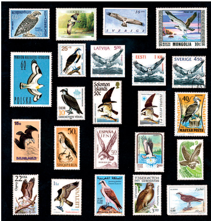
Ryc. 1. Rybłowy na znaczkach pocztowych