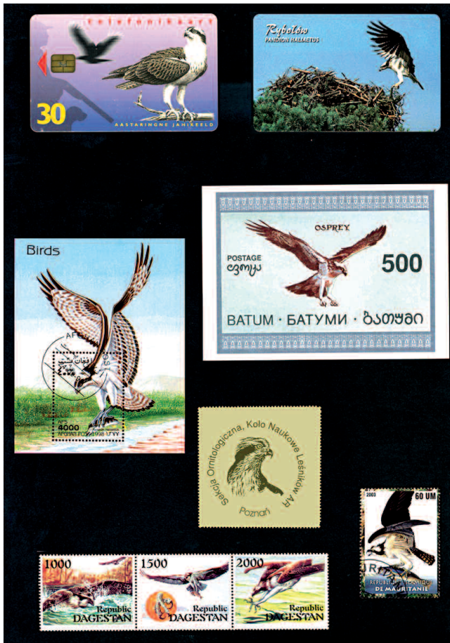
Ryc. 3. Karty telefoniczne z Estonii i Polski z rybołowem. Nieoficjalne znaczki z różnych obszarów Fig. 3. Osprey on two telephone cards from Estonia and Poland. Osprey "stamps label" from different areas

Pierwsze znaczki z ptakami pojawiły się już w połowie XIX wieku. W 1875 r. w Japonii ukazały się znaczki z stylizowanymi wizerunkami gęsi zbożowej Anser fabalis i gołębiarza Accipiter gentilis (Gibbons 2003). Najstarsze znaczki z rybołowem ukazały się w 1934 r. w Jugosławii. Łącznie w katalogach filatelistycznych sklasyfikowano około 111 znaczków z rybołowem. Ostatnio ptaki z rejonu Australii, Filipin, Indonezji i Nowej Kaledonii należące do podgatunku P. haliaetus cristatus uznano za oddzielny gatunek P. cristatus (ang. Eastern Osprey) (Christidis, Boles 2008; Wink et al. 2004). Zmianę tę uwzględniono w tab. 1.