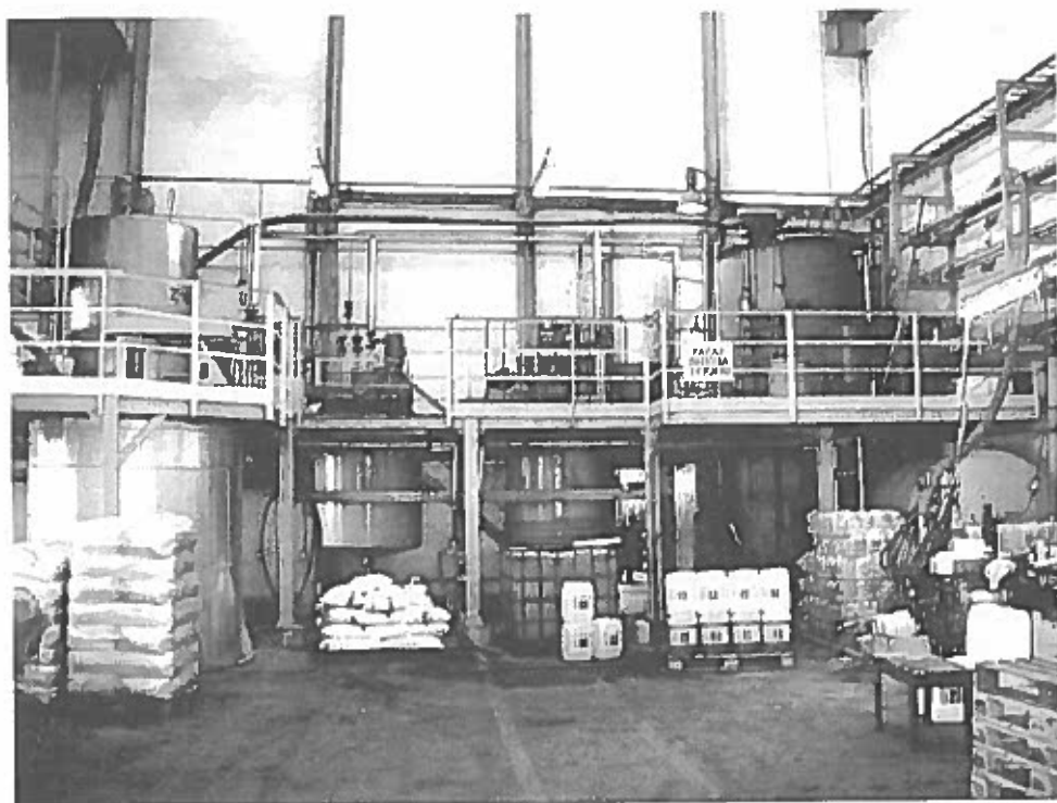
Rys. 1. Widok instalacji INS do produkcji nawozów INSOL

NTA – kwas nitylotrójocowy, CIT – kwas cytrynowy