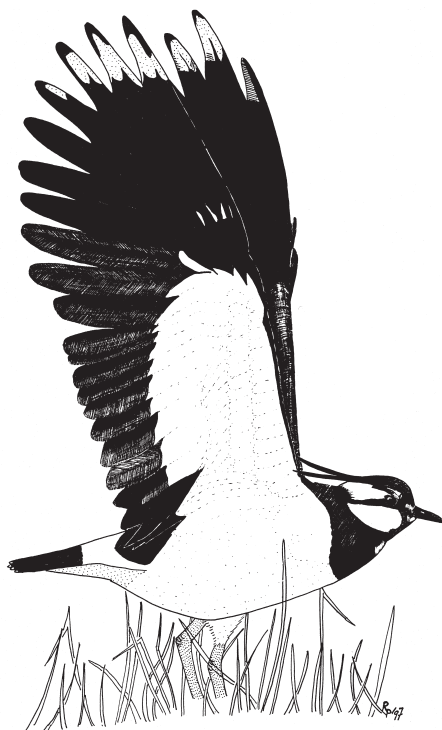
Rys. P. Rydzkowski