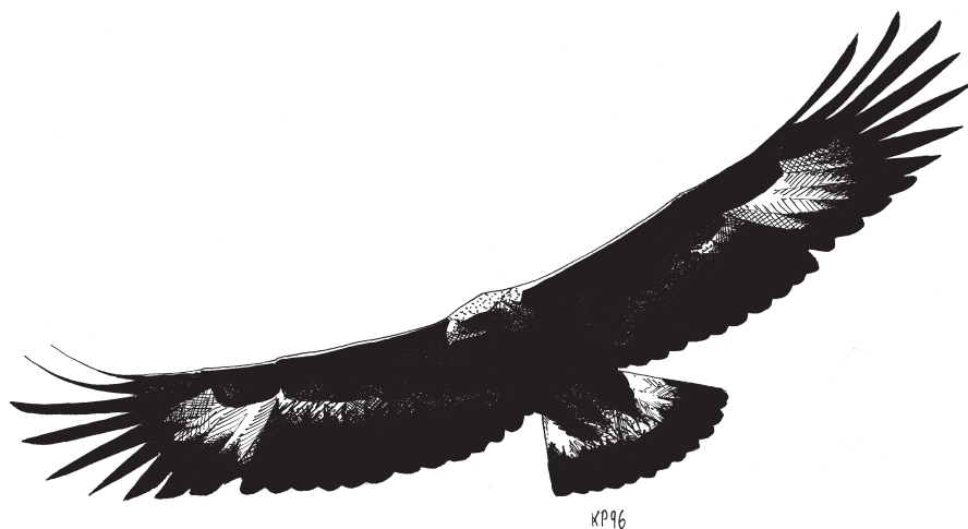
Rys. P. Kwiatkowski