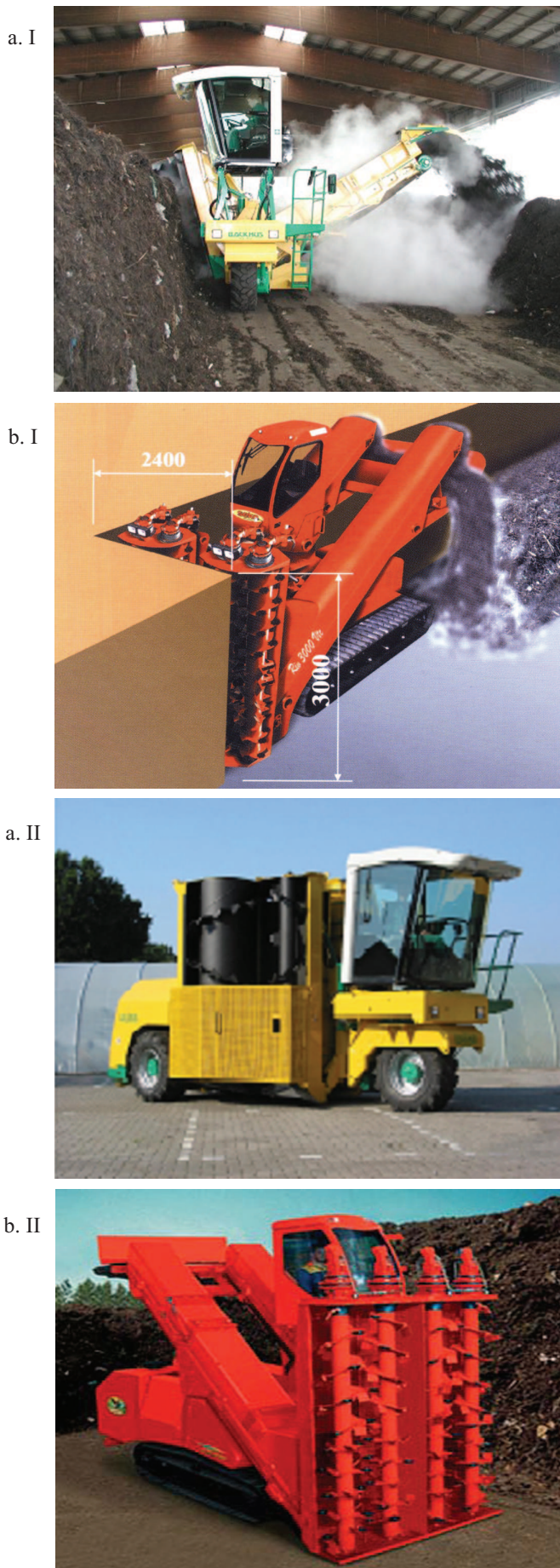
Rys. 2. Maszyny do przerobu pryzm taflowych: a - firmy Backhus model 10.30, b - firmy Seko model VTC 3000, I - w pozycji roboczej, II - w pozycji transportowej [2, 3]

Maszyny posiadają dwa (ewentualnie cztery - zgrupowane w dwa zespoły) wirniki z nawiniętymi śrubowo elementami frezującymi, pracujące w przeciwnych kierunkach. Umieszczone są one z prawej strony maszyny, w tunelu pomiędzy kołem przednim, a tylną osią (rys. 2a) lub na jej przodzie (rys. 2b). Wirniki z zamocowanymi na nich elementami dokonują frezowania bocznej lub przedniej części pryzmy. Ich zadaniem jest równomierne pobranie i wymieszanie różnych stref pryzmy oraz napowietrzenie jej. Taki materiał zostaje przekazany na przenośnik taśmowy, który usypuje po lewej stronie maszyny lub za nią (z tyłu) nową pryzmę. Pracuje on z prędkością do 5 m/s, co pozwala osiągnąć maszynom wydajność do 1600 m 3 /h - (Backhus 10.30) i do 3 000 m 3 /h - (Seko VTC 3000).