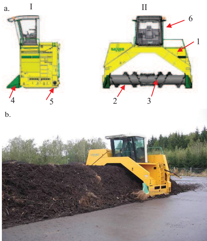
Rys. 1. Maszyna do przerobu pryzm trójkątnych firmy Backhus model 16.43: a - schemat, b - zdjęcie w czasie pracy, I - widok z boku, II - widok z przodu, 1 - tunel, 2 - wirnik, 3 - elementy boczne, 4 - zgarniacz, 5 - podwozie gąsienicowe, 6 - kabina [2]

nizm gąsienicowy - 5. Dzięki napędowi hydraulicznemu możliwe jest bezstopniowe dostosowanie prędkości jazdy do warunków pracy.