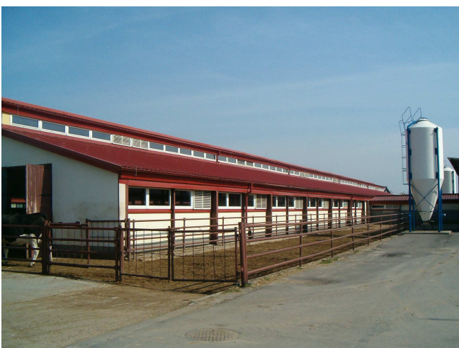
Rys. 3. Widok na świetlik dachowy z otworami wentylacyjnymi z regulowanymi żaluzjami