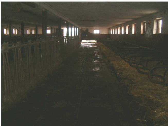
Rys. 7. Wnętrze obory - w ścianach szczytowych widoczne dwa wentylatory mechaniczne, a na ścianie bocznej otwory wentylacyjne