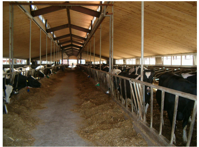
Rys. 4. Świetlik dachowy z otworami wentylacyjnymi oraz widocznymi przy oknach otworami nawiewnymi z regulowanymi żaluzjami