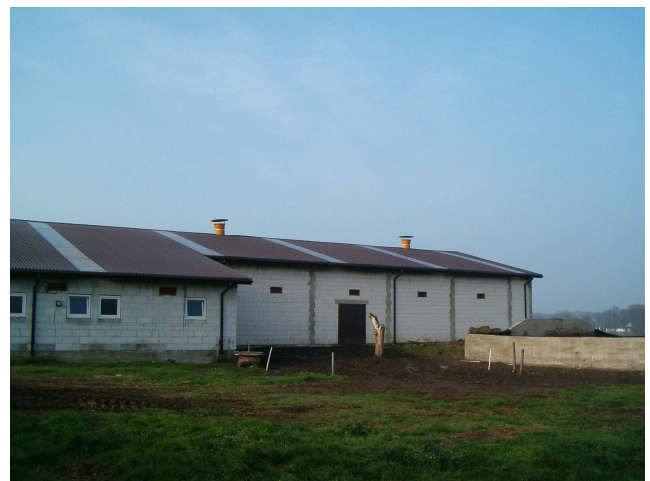
Rys. 5. Widoczne na dachu nasady wentylacyjne - typ Chanarda