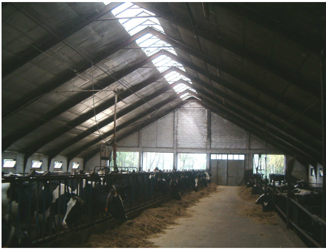
Rys. 1. Widok z wnętrza obory na szczelinę okapowo-kalenicową w świetliku dachowym - Bożenica