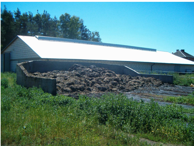
Rys. 2. Widok od strony dachu na szczelinę okapowo-kalenicową oraz świetlik dachowy, widoczne wiatrownice