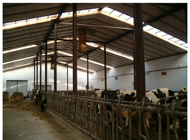
Rys. 6. Wnętrze obory widoczne kanały wentylacyjne w centralnej części pomieszczenia oraz otwory wentylacyjne z przepustnicami regulacyjnymi