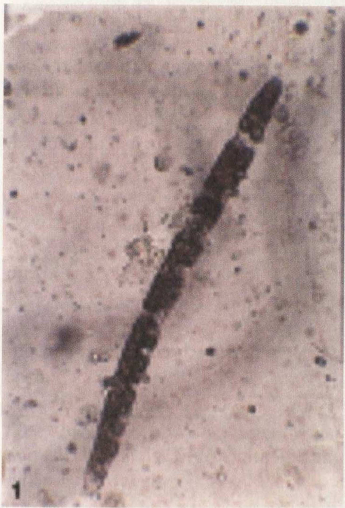
Rys. 1. Dictyuchus monosporus