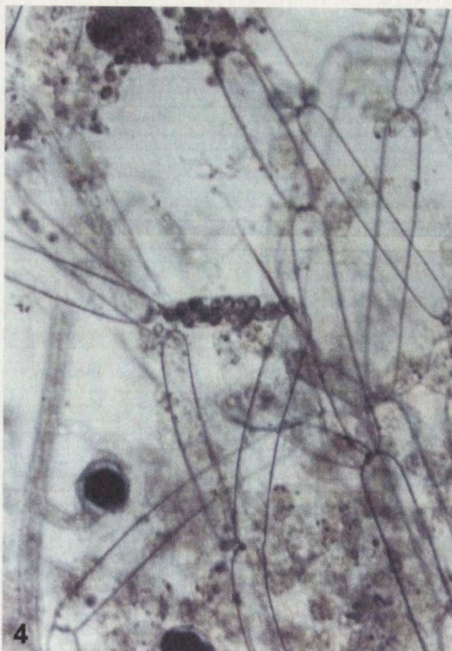
Rys. 4. Lepromitus lacetus