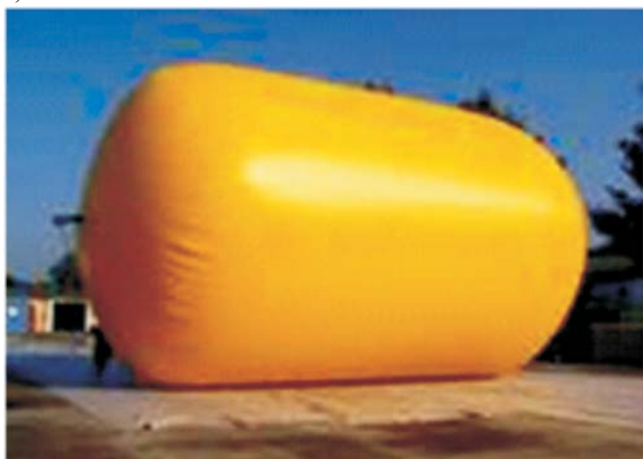
Rys. 5. Kanciasta forma poduszki gazowej (a) oraz walcowata forma poduszki gazowej (b) [5]