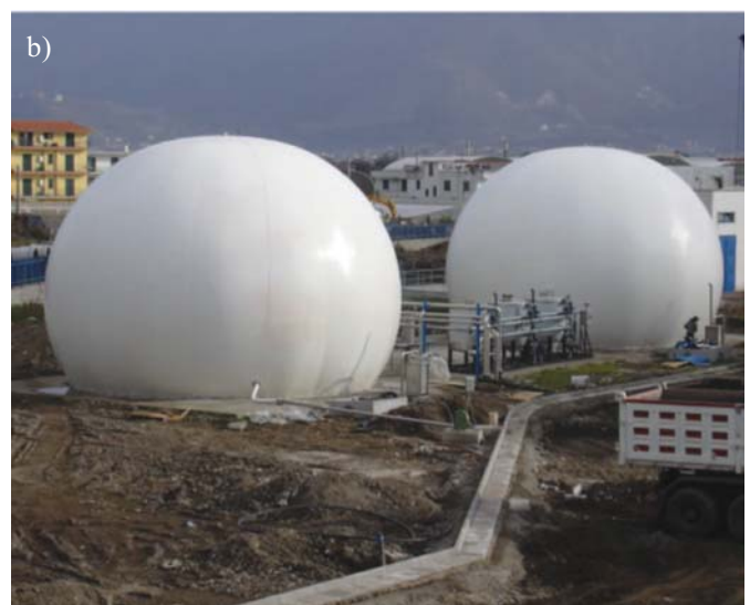
Rys. 1. Półsferyczny kształt zbiornika biogazu (a) oraz zbiornik biogazu o kształcie \frac{3}{4} sfery (b) [7]