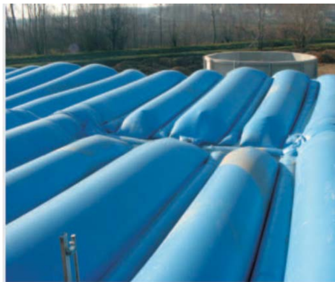
Rys. 4. Przykrycia pływające [7] Fig. 4. Floating covers [7]