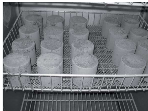
RYSUNEK 2. Próbkę w czasie pielęgnacji z cyklami zamrażanie – odmrażanie FIGURE 2. Samples during caring with frost – thaw cycles

go ściskania przy prędkości przesuwu tłoka 10,0 \text{ mm} \cdot \text{min}^{-1} . Próbkę o średnicy i wysokości 8 cm formowano przy wilgotności optymalnej dla danej mieszanki gruntu z cementem i wskaźniku zagęszczenia I_s \approx 1,0 (przy standardowej metodzie zagęszczania). Po uformowaniu próbek zabezpieczano je przed utratą wilgotności, a następnie przez ostatnie 14 dób n -dniowej pielęgnacji w temperaturze pokojowej z zabezpieczeniem przed wysychaniem poddawano nasączeniu wodą ( R_n ) lub cykлом zamrażania – odmrażania ( R_n \text{ Z-O} – rysunek 2). W przypadku wytrzymałości oznaczonej po 7 dobach próbki zabezpieczone były przed wysychaniem przez 3 doby, zanurzone w wodzie do głębokości 1 cm przez 1 dobę, a następnie przez ostatnie 3 doby zanurzone całkowicie, zgodnie z normą (PN-S-96012:1997). Wskaźnik mrozoodporności obliczono jako stosunek wytrzymałości na ściskanie oznaczonej dla próbek poddanych cykлом zamrażania i odmrażania do wytrzymałości próbek po pielęgnacji wodnej.