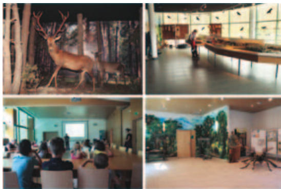
Fot. 1. Pomieszczenia edukacyjne w Centrum Edukacji Leśnej Photo 1. Educational rooms in the Forest Education Center

W obiekcie znajdują się 4 sale (fot. 1), w których można przeprowadzić niezależne od siebie zajęcia.