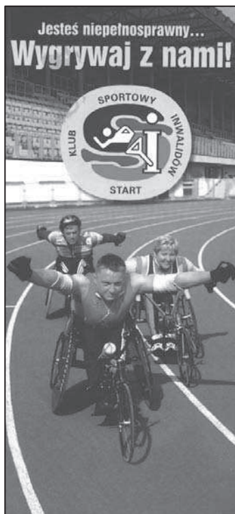
Fot. 1. Biuletyn informacyjny Klubu Sportowego Inwalidów „Start” Szczecin