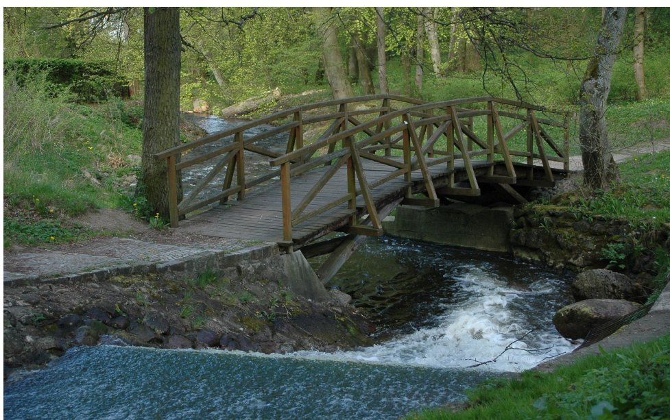
Rys. 4. Zdjęcie mostku w stylu japońskim

Część angielska znajduje się w głębi parku. Niezwykłego uroku i oryginalności dodają jej dwa niedawno odbudowane stawy, z groblą spacerową oddzielającą rzekę Wogrę, z mostkami w stylu japońskim, altanami i ławeczkami. W części krajobrazowej parku powstaje 23-hektarowy zalew, który – oprócz funkcji zbiornika retencyjnego – będzie miał ogromne znaczenie rekreacyjne (kąpielisko, łódki, rowery wodne, gondole – wszystko zagospodarowane w stylu retro). Teren parku, w tym również zalew na rzece Wogrę, pełni funkcje związane z lecznictwem uzdrowskim, obsługą uzdrowiska, budownictwem mieszkalno-pensjonatowym, turystyką, urządzeniami rekreacyjnymi i wypoczynkowymi. Znajduje się tu wiele domów uzdrowskich oraz pensjonatów oferujących noclegi i usługi lecznicze, rehabilitacyjne itp. Zagospodarowanie terenu parku zdrojowego pozwoli stworzyć warunki do rozwoju wielu ważnych i centrotwórczych usług dla mieszkańców i turystów. Aby Połczyn-Zdrój miał stać się głównym ośrodkiem turystycznym i kulturalnym regionu, jego rozwój powinien opierać się przede wszystkim na rewitalizacji głównej atrakcji turystycznej miasta, tj. parku zdrojowego. Rysunek 4 (zdjęcie) przedstawia efekty rewitalizacji architektury krajobrazu parku zdrojowego w Połczynie-Zdroju.