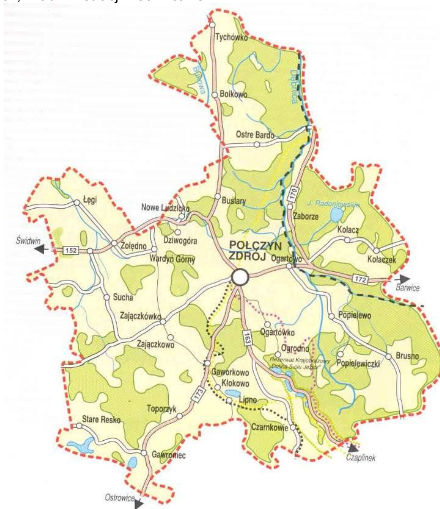
Rys. 2. Lokalizacja Połczyna-Zdroju