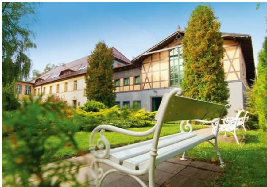
Rys. 3. Zdjęcie Sanatorium „Irena”

Rysunek 3 przedstawia zdjęcie Sanatorium „Irena” po renowacji obiektu.