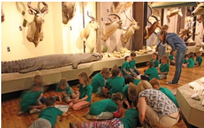
Fot. 3. Lekcja muzealna w Sali Oko w oko Photo 3. Museum lesson in Eye to eye room

Wszystkie lekcje są prowadzone za zastosowaniem metod aktywizujących uczniów (fot. 3) zgodnie z koncepcją Johna Deweya „uczenie się przez działanie”, która zakłada, że najlepsze efekty w edukacji daje połączenie teorii z praktyką (Radecki 2015). Wykorzystywane są materiały edukacyjne, dzieci rozwiązują różnorakie zadania i odpowiadają na pytania prowadzącego. Scenariusz każdej lekcji jest wzbogacony o karty pracy dostosowane do wieku uczniów. Jest to bardzo ważny element lekcji muzealnych biorąc pod uwagę fakt, iż według niektórych, zdobywanie wiedzy przy pomocy samych eksponatów jest bardzo trudne i wymagające (Unger 2007). Każde urozmaicenie zajęć wpływa pozytywnie na odbiór przekazywanej wiedzy.