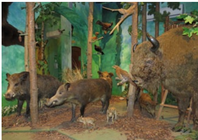
Fot. 1. Sala W polu i w kniei I „Las” Photo 1. Room The Field and the Forest I “Forest”