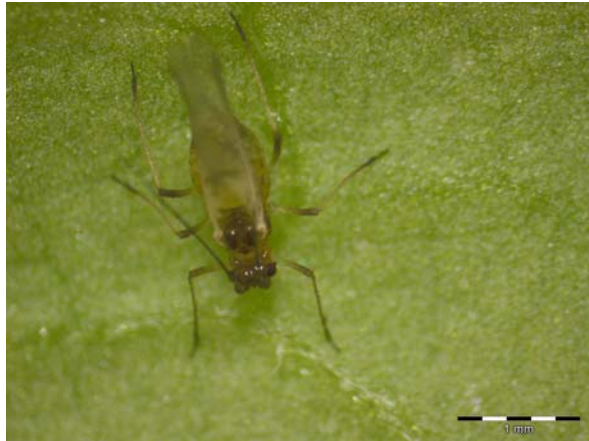
Fot. 2. Mszyca brzoskwiowa Myzus persicae na liściu ziemniaka, forma uskrzydłona