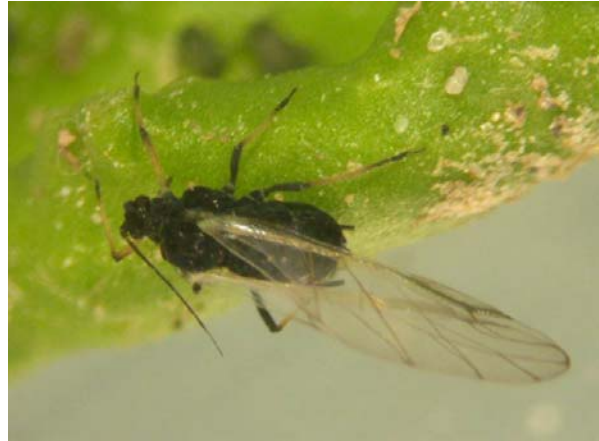
Fot. 3. Mszyca burakowa Aphis fabae – forma uskrzydłona, efektywny wektor PVY (fot. internet, Fotolib.cz)

Wczesny pojaw uskrzydłonych mszyc M. persicae zaobserwowano w Czernikowie (12.06.) i Szymankowie (19.06.), a w pozostałych miejscowościach owady uskrzydłone sukcesywnie pojawiały się w szalkach do II dekady lipca. W Drogoszach, Karwnie i Rumsku gatunek ten w ogóle nie wystąpił (tab. 2).