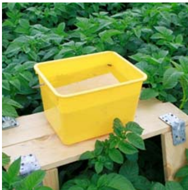
Fot. 1b. Żółte naczynia na polu w łanie ziemniaków – plantacja AgroFundusz Mazury, Drogosze, lipiec 2017

W roku 2017 mszyce nalatujące na plantacje ziemniaka odnotowano najwcześniej w Karwnie i Rumsku (15 maja) oraz Boninie i Czarnoszytach (19 maja), a 3-13 dni później różne gatunki mszyc odławiano w pozostałych miejscowościach (tab. 2). Były to jednak głównie mszyce obce, niezwiązane żywicielsko z ziemniakiem, tzw. mszyce niezemia-czane, trafiające do żółtych naczyń przypadkowo, w poszukiwaniu swoich właściwych żywicieli w środowisku. W tym miejscu trzeba podkreślić, że wiele z tych gatunków ma zdolność przenoszenia także wirusów ziemniaka w sposób nietrwały (niekrążeniowy) na kłujce w czasie próbnych nakłuczeń roślin (Ko-