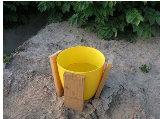
Fot. 1a. W odłowionym materiale oprócz mszyc mogą znajdować się także inne owady reagujące na żółty kolor: zapylające, błonkówki, chowacze i słodyszek rzepakowy