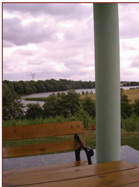
Rysunek 2. Widok z gospodarstwa na własne jezioro Figure 2. View from the farm on their own lake