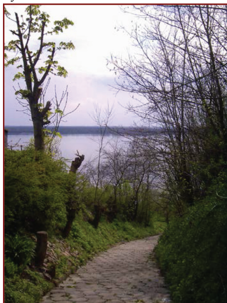
Rysunek 1. Położenie gospodarstwa w sąsiedztwie rzeki Wisły Figure 1. The location of the farm in the vicinity of the river Vistula

Na portalu internetowym usługodawcy dostarczają przyszłym turystom szereg zdjęć obrazujących najbliższe otoczenie zagrody (ryciny: 1, 2, 3, 4). Niemniej, jak podkreślają Młynarczyk i Potocka (2010), człowiek ma różne preferencje krajobrazowe, które są uzależnione od płci, wieku, wykształcenia, miejsca zamieszkania, a także jego korzeni kulturowych. Dodają, że wprowadza to trudności w określeniu, jakie cechy powinien mieć krajobraz, aby się podobał. Inaczej ocenia się – bowiem krajobraz przedstawiony na zdjęciu, niż ten oglądany w rzeczywistości. To bardzo istotna sugestia dla usługobiorców, aby nie poczuli się w przyszłości rozczarowani, że miejsce, które wybrali na urlop nie spełnia ich potencjalnych oczekiwań.