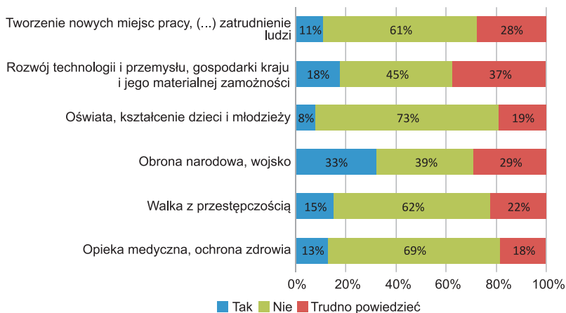
Ryc. 3. Dotowanie LKP „Lasy Janowskie” a inne dziedziny życia społecznego.

O ile ponad połowa respondentów (515 osób, tj. 63%) byłaby gotowa w sytuacji zagrożenia dla istnienia LKP wpłacać składki na jego ochronę, to niezbyt wielu wskazywało jakąś dziedzinę życia społecznego, na której należy zaoszczędzić w celu zdobycia pieniędzy na utrzymanie Lasów Janowskich. Szczegółowe odpowiedzi dotyczące tego zagadnienia zawiera rycina 3.