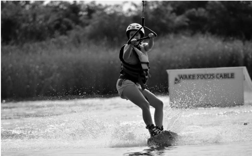
Fot. 1. Korzystająca z wakeboardingu na zbiorniku w Żółtańcach