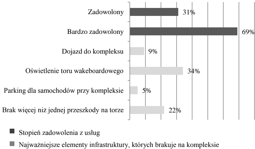
Wykres 2. Poziom zadowolonia klientów oraz wskazania odnośnie do brakujących elementów infrastruktury/zagospodarowania kompleksu w Żółtańcach

kreślają jego fachowość, co przekłada się na stopień ogólnego zadowolenia z usług oferowanych w kompleksie – 69% jest bardzo zadowolonych, a 31% zadowolonych z jakości obsługi (wykres 2).