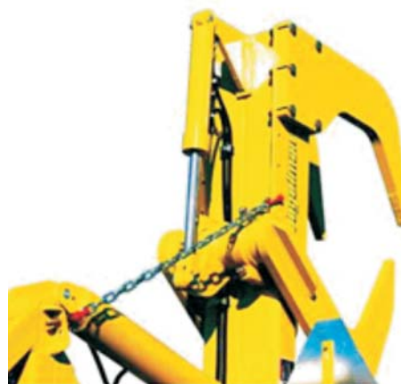
Rys. 5. Wyciągacz kamieni RD 320 firmy Degelman: a) transport po drodze, b) łańcuch zabezpieczający z karabińczykami [9] Fig. 5. Degelman's rock digger RD 320: a) transport on the road, b) safety chain with snap hook [9]