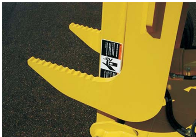
Rys. 3. Karbowane zęby chwytające [9] Fig. 3. Serrated grabbing teeth [9]