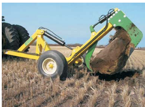
Rys. 2. Wyciągacz kamieni firmy Bergen [8] Fig. 2. Rock digger by Bergen [8]

Długość zębów decyduje o głębokości kopania dochodzącej obecnie do 1 m. Zęby podkopujące i wyciągające są w tym celu odpowiednio wyprofilowane, podobnie jak ramiona przytrzymujące. Mają one zapewnić stabilny uchwyt i utrzymanie kamienia, pozwalając na jego transport i odłożenie na skraju pola. Właściwe wyprofilowanie zębów ogranicza poślizg między powierzchniami elementów i kamienia oraz zapobiega jego wypadnięciu z uchwytu. Zęby są ustawione pod odpowiednim kątem, tak aby umożliwić łatwe zagłębienie w podłoże i podebranie kamienia [8, 9, 10]. Zaostrzone końcówki zębów są poprzecznie nacinane (mają karby) dla jeszcze lepszego uchwycenia kamienia, zapobiegającego jego wysłizgnięciu z uchwytu (rys. 3). Stosuje się wymienne końcówki płyt podkopujących (rys. 4). Elementy robocze w postaci płyt przykręcanych do ramy mogą być wykorzystane do głęboszowania. To pozwala na zwiększenie zakresu zastosowania i efektywności oraz poprawę wskaźników eksploatacyjno-ekonomicznych.