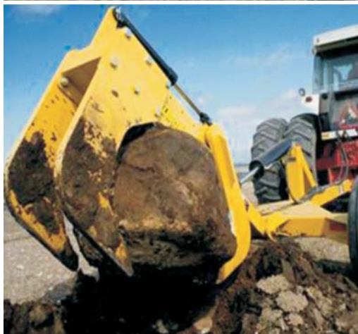
Rys. 1. Wyciągacz kamieni RD 320 firmy Degelman [9] Fig. 1. Rock digger RD 320 by Degelman [9]