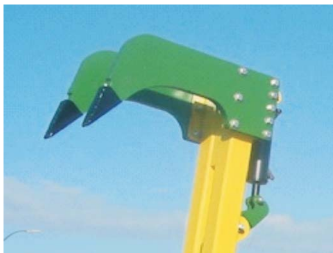
Rys. 4. Zęby z wymiennymi, ścierającymi się końcówkami [8] Fig. 4. Teeth with replaceable wear tips [8]

Aby w pełni wykorzystać cechy funkcjonalne maszyny należy dokonać właściwego doboru ciągnika jako źródła energetycznego spełniającego wymagania w zakresie przeniesienia napędu. Agregat ciągnikowy powinien zachować stateczność wzdłużną i poprzeczną oraz spełniać warunki bezpieczeństwa podczas pracy, transportu i postoju (rys. 5). Ciągnikowe agregaty maszynowe są obsługiwane przez jednego operatora (traktorzystę).