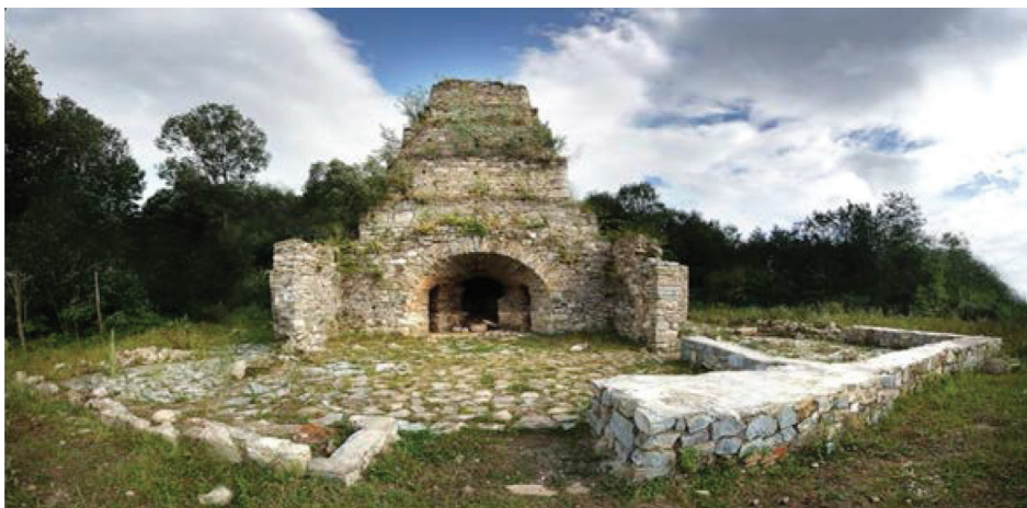
Rysunek 1. „Anheluwska domnycia” – zabytek kultury rzemieślniczej XIX w. (lipiec 2012)