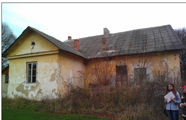
Fot. 2. Budynek dawnego dworu w miejscowości Bazar-Pilaszkowice Phot. 2. The old manor house in the Bazar-Pilaszkowice village