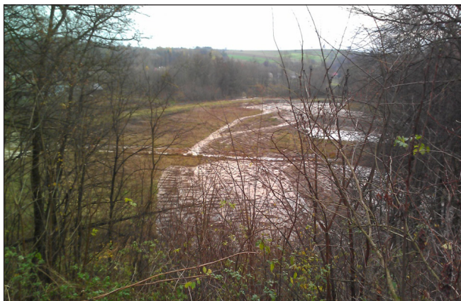
Fot. 1. Widok na staw rybny ze skarpy przy Dworze Sobieskich Phot. 1. A view on the fish pond from a slope near the Sobieski manor house