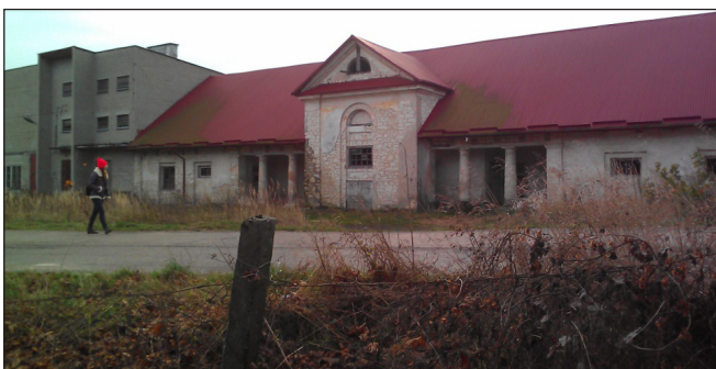
Fot. 3. Budynek dawnego spichlerza z gorzelnią w miejscowości Bazar-Pilaszkowice Phot. 3. The old granary and distillery in the Bazar-Pilaszkowice village