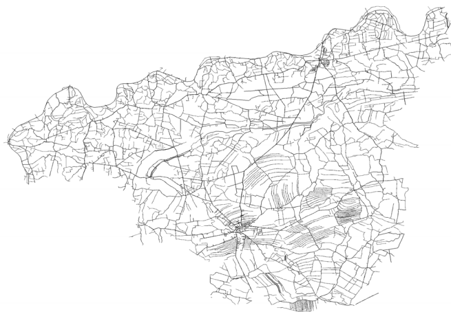
Rysunek 1. Mapa sieci dróg transportu rolnego na terenie powiatu dąbrowskiego Figure 1. The map of agricultural transport road network in the Dąbrowski administrative district.

Przeprowadzona analiza dla wszystkich obrębów powiatu dąbrowskiego pozwoliła na przedstawienie zidentyfikowanego zbioru elementów sieci drogowej (rycina 1), oraz obszarów (działek), nie posiadających dostępu do zdefiniowanej wcześniej sieci drogowej (dane zawężone do działek z podgrup rejestrowych 7.1 oraz 7.2), (rycina 2).