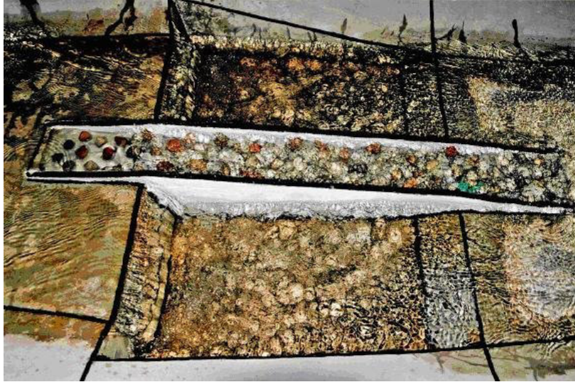
Fotografia 1. Model przepławki – wariant III c (przepływ Q_N = 4 \text{ m}^3 \cdot \text{s}^{-1} ) Photography 1. Model of the fish passed – variant III c (flow discharge Q_N = 4 \text{ m}^3 \cdot \text{s}^{-1} )