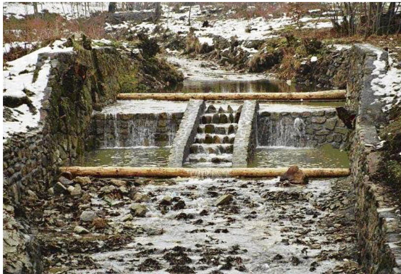
Fotografia 2. Przepławka ryglowa, widok od wody dolnej, Czarny Potok (autor Niesobski) Photography 2. The half-timbered fish passed, view from downstream water stage, stream Czarny Potok (author Niesobski)