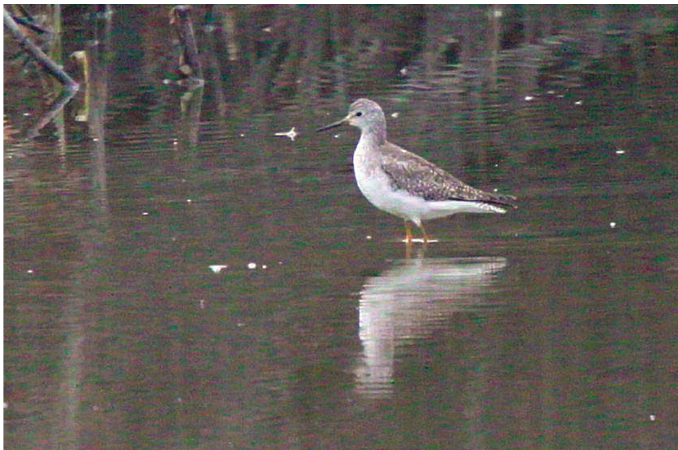
Fot. 8. Brodziec żółtonogi Tringa flavipes , Wielikąt, październik–listopad 2013 – Lesser Yellowlegs, Wielikąt, October–November 2013