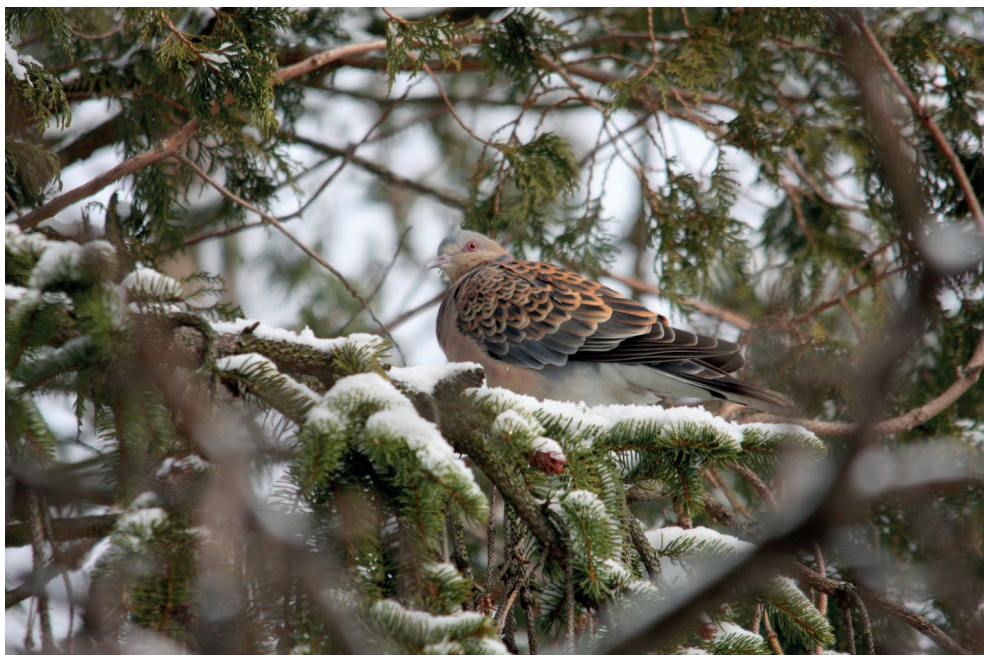
Fot. 12. Turkawka wschodnia Streptopelia orientalis , Suchedniów, luty–kwiecień 2013 – Oriental Turtle Dove, Suchedniów, February–April 2013