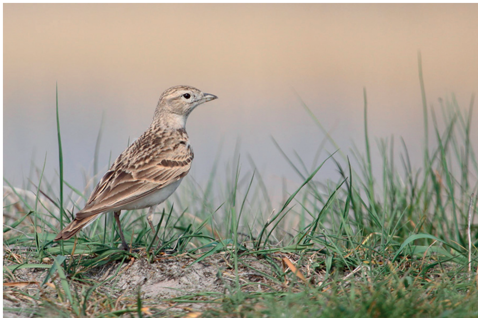
Fot. 15. Skowrończyk krótkopalcowy Calandrella brachydactyla , Karsiborska Kępa, maj 2013 – Short-toed Lark, Karsiborska Kępa, May 2013