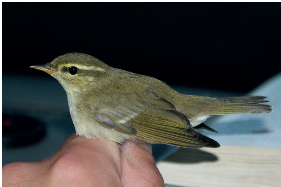
Fot. 20. Świstunka północna Phylloscopus borealis , Kopań, wrzesień 2013 – Arctic Warbler, Kopań, September 2013