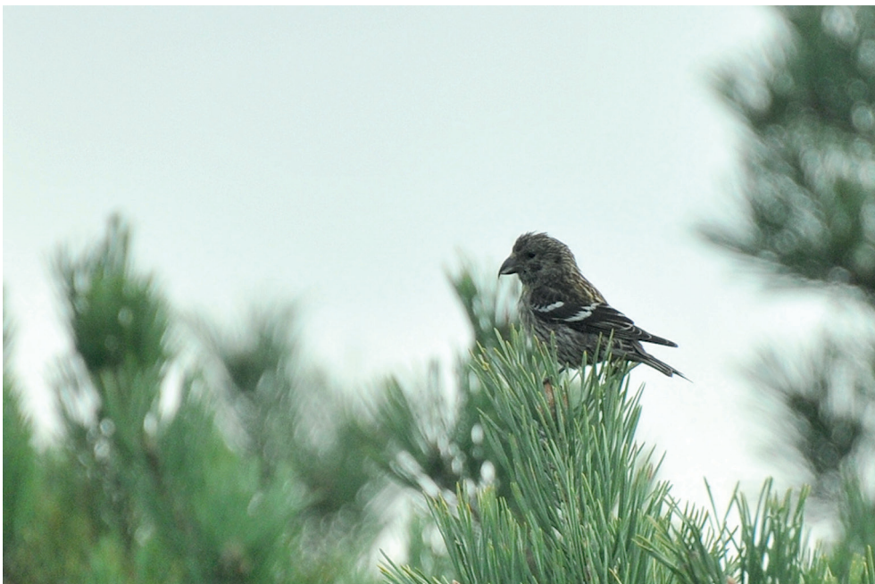
Fot. 23. Krzyżodziób modrzewiowy Loxia leucoptera , Krynica Morska, październik 2013 – Two-barred Crossbill, Krynica Morska, October 2013