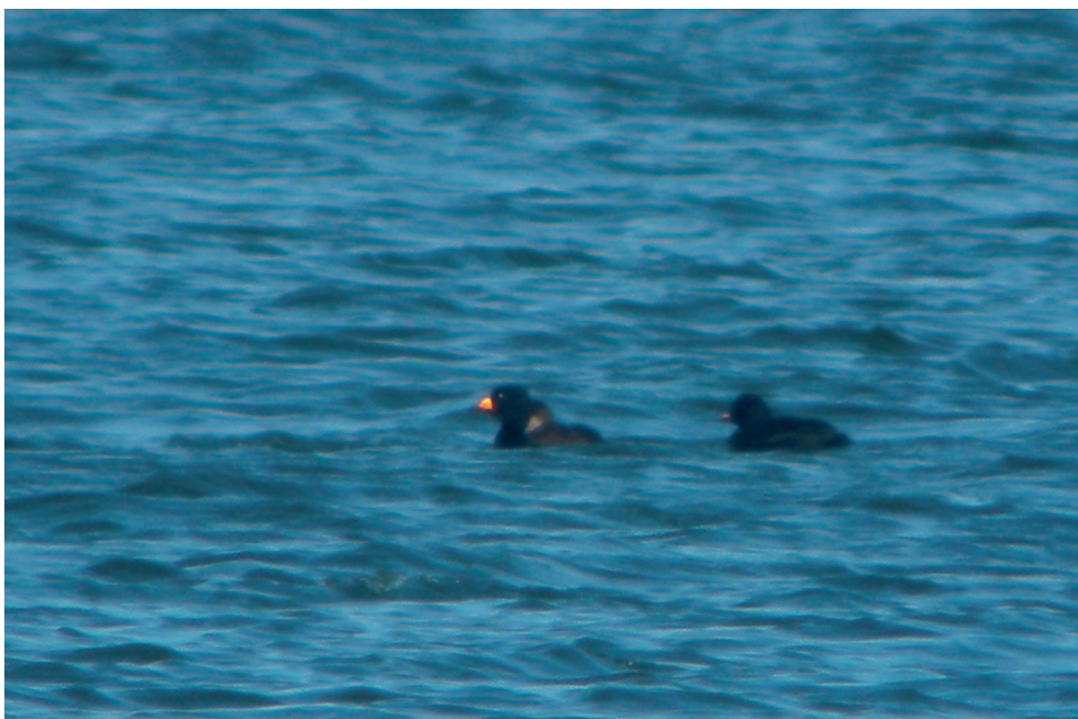
Fot. 2. Markaczka amerykańska Melanitta americana , Łukęcin, marzec 2013 – Black Scoter , Łukęcin, March 2013