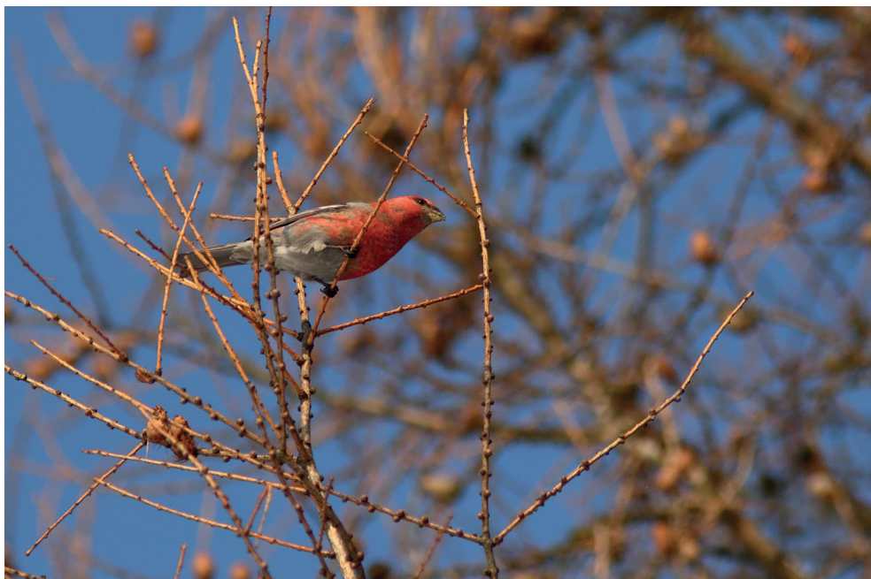
Fot. 24. Łuskowiec Pinicola enucleator , Jurkowo, luty 2013 – Pine Grosbeak, Jurkowo, February 2013