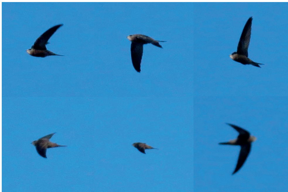
Fot. 14. Jerzyk bładny Apus pallidus , Kołobrzeg, październik 2013 – Pallid Swift, Kołobrzeg, October 2013