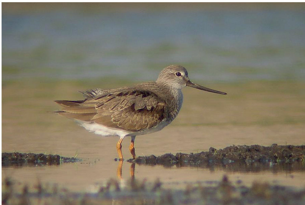
Fot. 9. Terekia Xenus cinereus , Kornie, maj 2013 – Terek Sandpiper, Kornie, May 2013