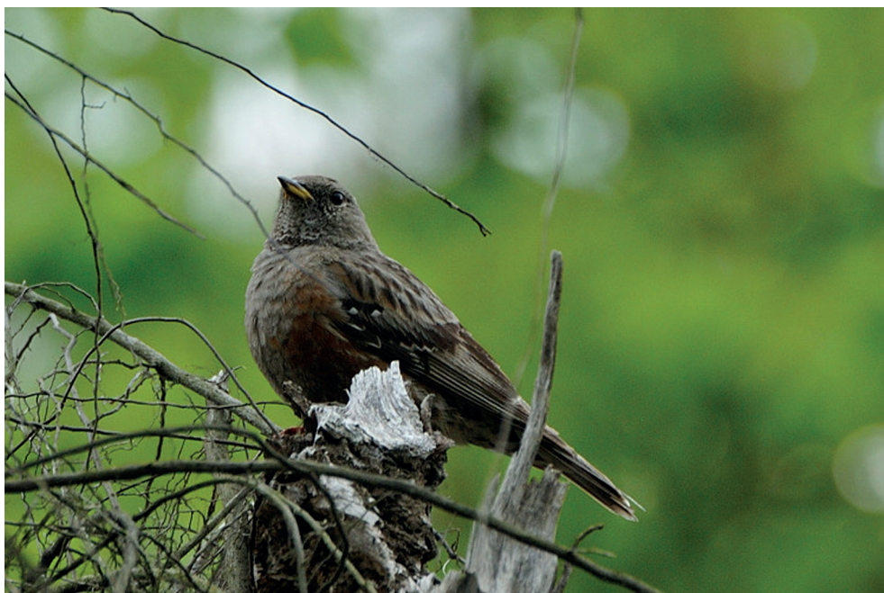
Fot. 17. Płochacz halny Prunella collaris , Sitno, maj 2013 – Alpine Accentor, Sitno, May 2013