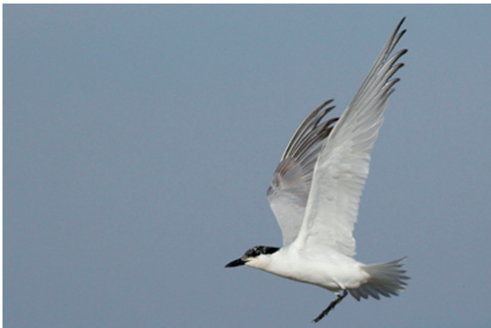
Fot. 10. Rybitwa krótkodzioba Gelochelidon nilotica , ujście Wisły, sierpień 2013 (fot. D. Kilon) – Gull-billed Tern, Vistula mouth, August 2013