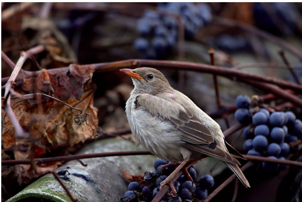
Fot. 22. Pasterz Pastor roseus , Osieczna, listopad–grudzień 2013 – Rose-coloured Starling, Osieczna, November–December 2013