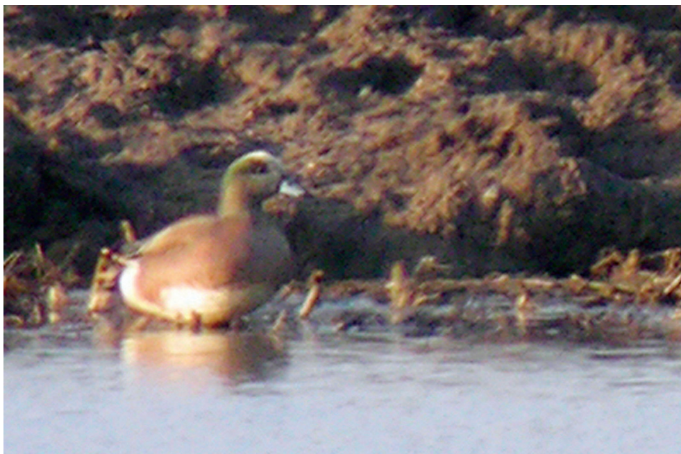
Fot. 1. Świstun amerykański Anas americana , Sitno, kwiecień 2013 – American Wigeon , Sitno, April 2013