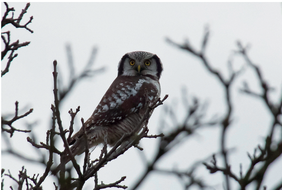
Fot. 13. Sowa jarzębata Surnia ulula , Pniewo, listopad 2013 – Hawk Owl, Pniewo, November 2013