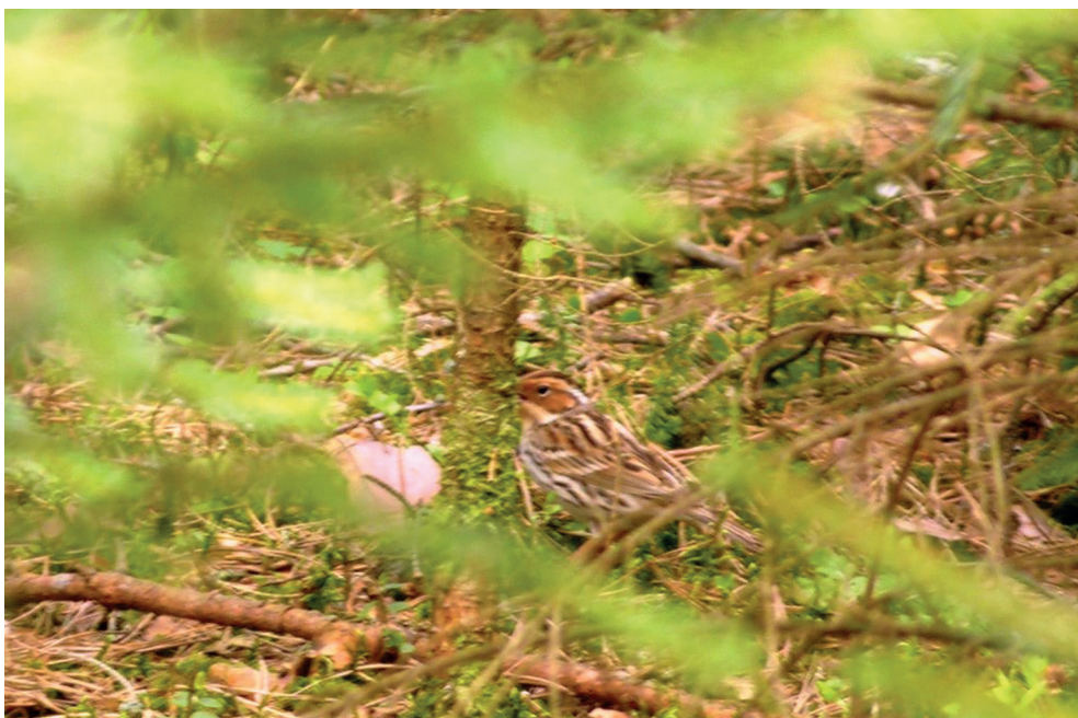
Fot. 25. Trznadelek Emberiza pusilla , Krasne, maj 2013 – Little Bunting, Krasne, May 2013