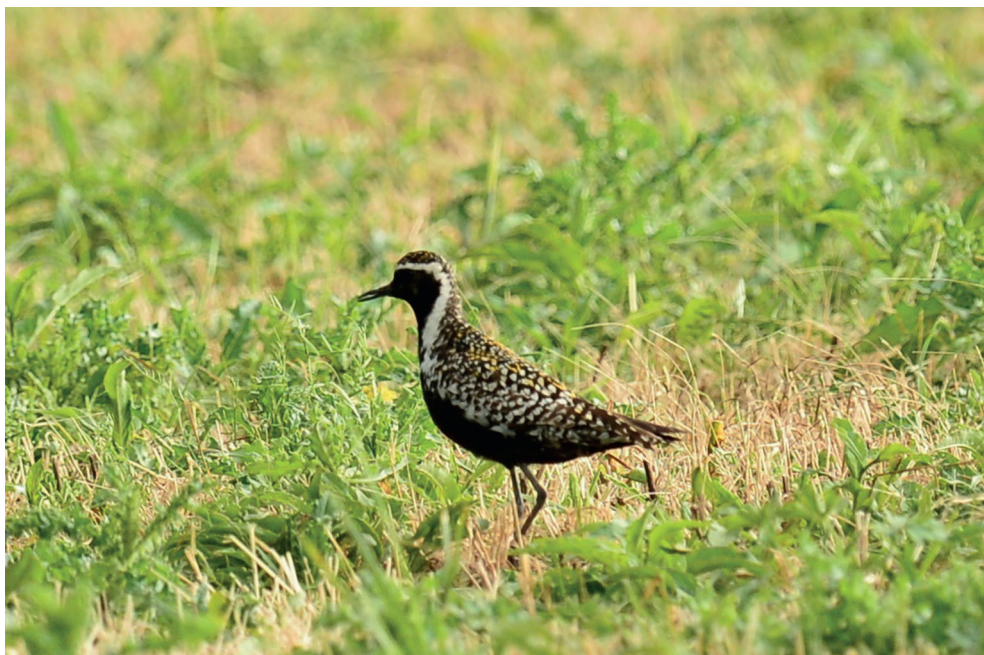
Fot. 7. Siewka złotawa Pluvialis fulva , Łaszka, lipiec 2013 – Pacific Golden Plover, Łaszka, July 2013