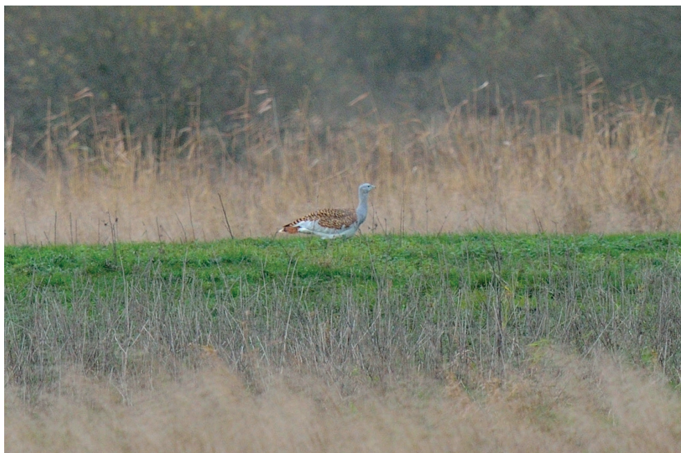
Fot. 6. Drop Otis tarda , PN Ujście Warty, listopad 2013 – Great Bustard, Warta Mouth National Park, November 2013