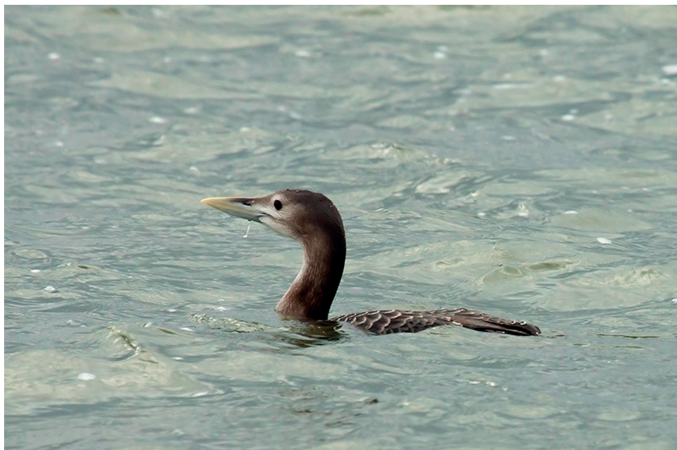
Fot. 3. Nur białodzioby Gavia adamsii , Zb. Goczałkowicki, grudzień 2013 – styczeń 2014 – Yellow-billed Diver , Goczałkowicki Reservoir, December 2013 – January 2014