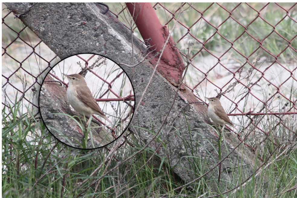
Fot. 19. Zaganiacz mały Hippolais caligata , Jastarnia, maj 2013 – Booted Warbler , Jastarnia, May 2013