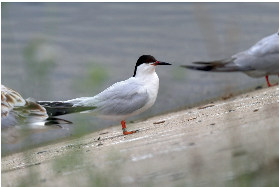
Fot. 11. Rybitwa różowa Sterna dougallii , Zb. Mietkowski, lipiec 2013 – Roseate Tern, Mietkowski Reservoir, July 2013