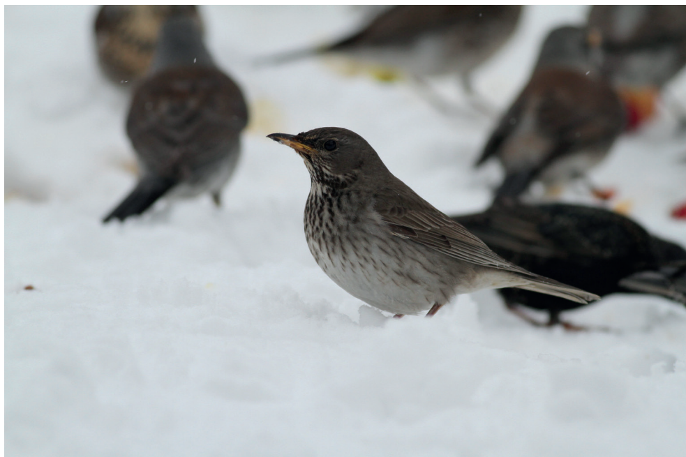
Fot. 18. Drozd czarnogardły Turdus atrogularis , Płaza, kwiecień 2013 – Black-throated Thrush , Płaza, April 2013