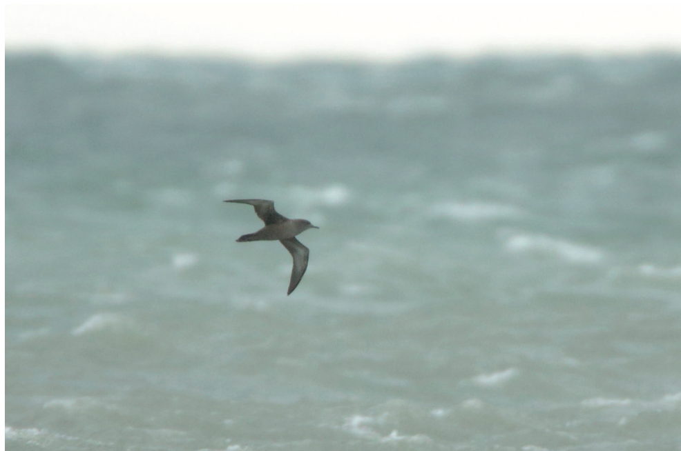
Fot. 4. Burzyk szary Puffinus griseus , Hel, grudzień 2013 – Sooty Shearwater , Hel, December 2013