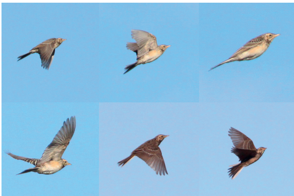
Fot. 16. Świergotek szponiasty Anthus richardi , Wiejkowo, wrzesień 2013 – Richard's Pipit, Wiejkowo, September 2013