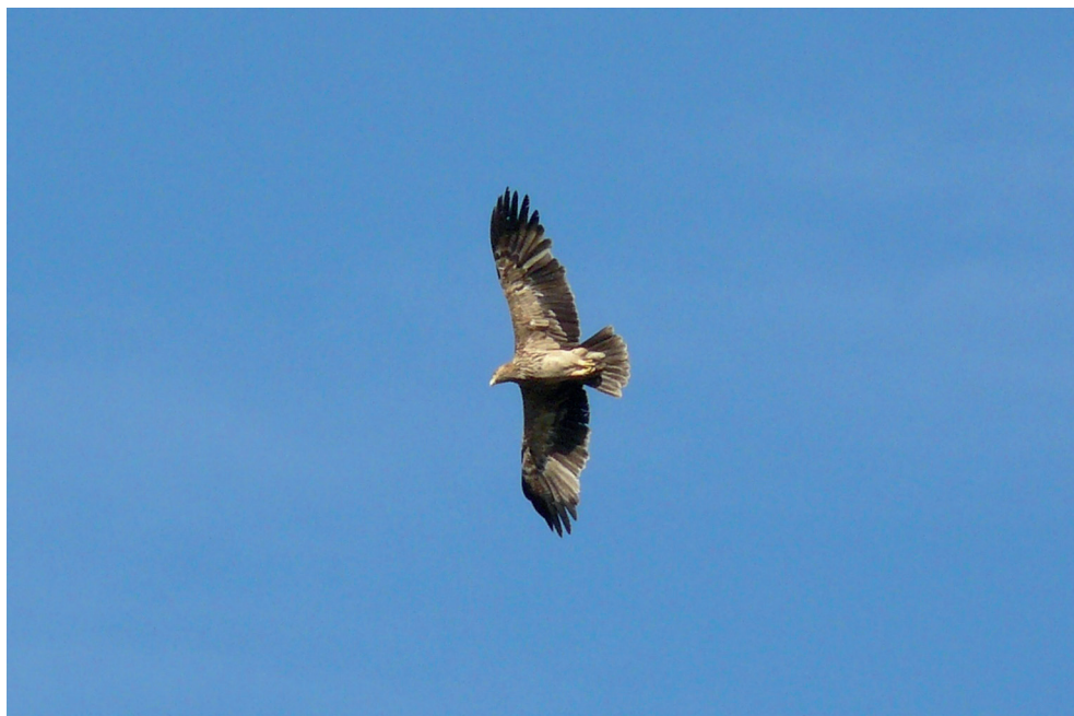
Fot. 5. Orzeł cesarski Aquila heliaca , Grodowice, lipiec 2013 – Imperial Eagle, Grodowice, July 2013