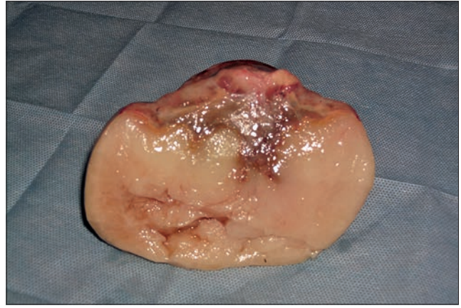
Ryc. 3. Tłuszczak po usunięciu

był zbitą, ciastowatą treścią. Zabieg trwał 2 godz., wybudzenie przebiegło bez komplikacji. Sześć godzin po zabiegu rozpoczęto karmienie małymi porcjami siana, co trzy godziny, stopniowo zwiększając ilość. Ograniczono dostęp do wody. Poje nie rozpoczęto sześć godzin po zabiegu, zaczynając od podawania litra wody co trzy godziny, równocześnie stosując płynoterapię parenteralną uzupełniającą zapotrzebowanie dobowe. Gojenie rany pooperacyjnej przebiegało bez komplikacji. Koń został odebrany przez właściciela 8 dni po zabiegu. W okresie pooperacyjnym koń otrzymywał gentamycynę (8,8 mg/ kg m.c., co 24 godziny), benzylopenicylinę prokainową oraz benzatynową (Penicillin L.A.®, 6 mg/ kg m.c., co 24 godziny), megluminię fluniksyny (0,25 mg/ kg m.c., co 6 godzin). Badanie histopatologiczne potwierdziło rozpoznanie śródoperacyjne (ryc. 4).