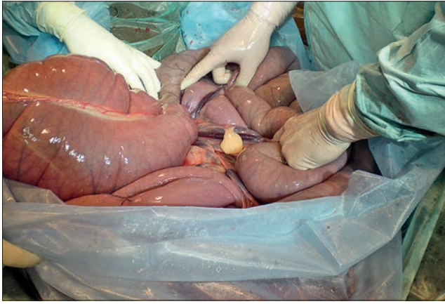
Ryc. 2. Uszypułowany tłuszczak. Zdjęcie śródoperacyjne