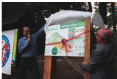
Fot. 1. Uroczyste odsłonięcie tablicy 16. obszaru „znajdziewlesie.pl” w Jeleniej Górze jesienią 2018 r. Photo 1. A ceremonial unveiling of the board of 16-th area “znajdziewlesie.pl” in Jelenia Góra in autumn of 2018

Na popularność, którą mierzono poprzez liczbę „ściągniętych” ze strony internetowej map z danym obszarem wpływ ma także niewątpliwie czas istnienia projektu. Te najstarsze mają z reguły największą liczbę pobrań, a nowe (takie jak np. projekt w Jeleniej Górze, czy Brzegu) – najmniejszą (fot. 1)