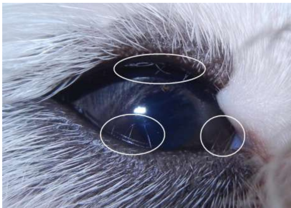
Fot. 1. Distichiasis. Nieliczne, cienkie rzęsy.

lub któryś z w/w mięśni są nieprawidłowe, to ułożenie i kierunek wzrostu rzęs mogą ulec zaburzeniu (Kański). Nieprawidłowy wzrost rzęs (trichiasis) jest często nabytym schorzeniem, które może występować jako postać izolowana lub być wynikiem bliznowacenia brzegu powieki. Trichiasis należy różnicować z pseudotrachiasis, powstałym wtórnie do podwinięcia powiek. Tylne ukierunkowanie wzrostu rzęs, wyrastających z prawidłowych miejsc, prowadzi do punktowych uszkodzeń nabłonka rogówki, a w przypadkach długotrwałych może nawet doprowadzić do powstania owrzodzenia rogówki (Kański) (Maggs). Oprócz tego typu patologii rzęs wyróżniamy jeszcze dwa rodzaje ich nieprawidłowości. Jedną z takich nieprawidłowości jest dwurzędowość rzęs (distichiasis) często spotykana u ras takich jak: pudel, maltańczyk, west highland white terrier czy też cocker spaniel, shih tzu. U tych ras psów choroba ma prawdopodobnie podłoże dziedziczne (Maggs) (Reinstein, Gross i Komaromy), (Fot. 1).