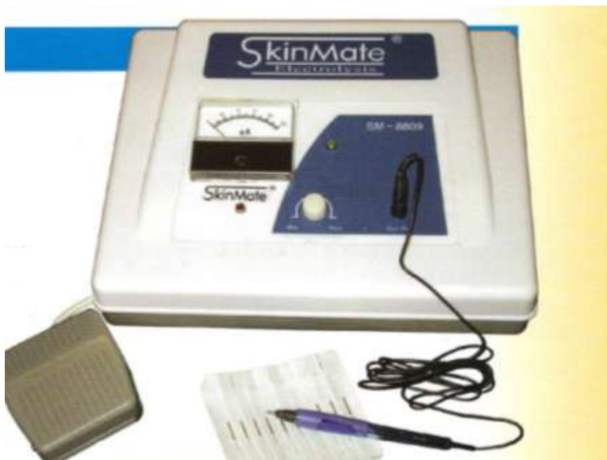
Fot. 4. Elektroepilator SkinMate.

Do zabiegu elektroepilacji rzęs zakwalifikowano sześciomiesięcznego psa rasy west highland white teriera, u którego stwierdzono distichiasis powieki górnej i dolnej. Zabieg wykonano elektroepilatorem SkinMate model SM-8809 (Fot.4). Jest to jednostka kompaktowa, w której można w sposób płynny regulować natężenie prądu - zakres tej regulacji wynosi od 0 do 100 \mu A. Czas oddziaływania prądu reguluje się przyciskiem nożnym. Zwykle potrzebne jest ok. 10 – 20 sek. do uzyskania efektu epilacji rzęsy. Elektrode, stanowi cienka stalowa igła o tępym zakończeniu, zamocowana do końcówki w kształcie długopisu. Zabieg epilacji polega na wprowadzeniu, pod odpowiednim powiększeniem (lupa oczna, mikroskop operacyjny), elektrody bezpośrednio do mieszka włosowego. Impuls elektryczny przepływający przez elektrodę powoduje koagulację białek, co trwale uszkadza macierz mieszka rzęsy. Makroskopowym wskaźnikiem udanej koagulacji jest pojawienie się