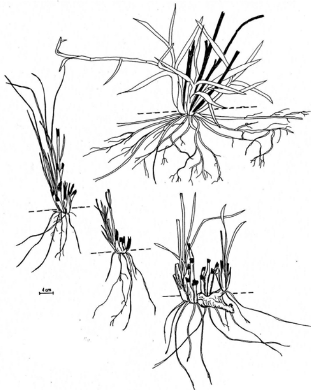
Ryc. 9. Niektóre cechy traw – pirofitów; kępy liści tylko częściowo spalone, pączki odnawiające powstaną tuż przy ziemi.

Podobne przystosowania do ognia znaleźć można u sitów, przedstawicieli rodzaju Scirpus (Cyperaceae), niektóre z nich mają też cechy zbliżające je do geo-