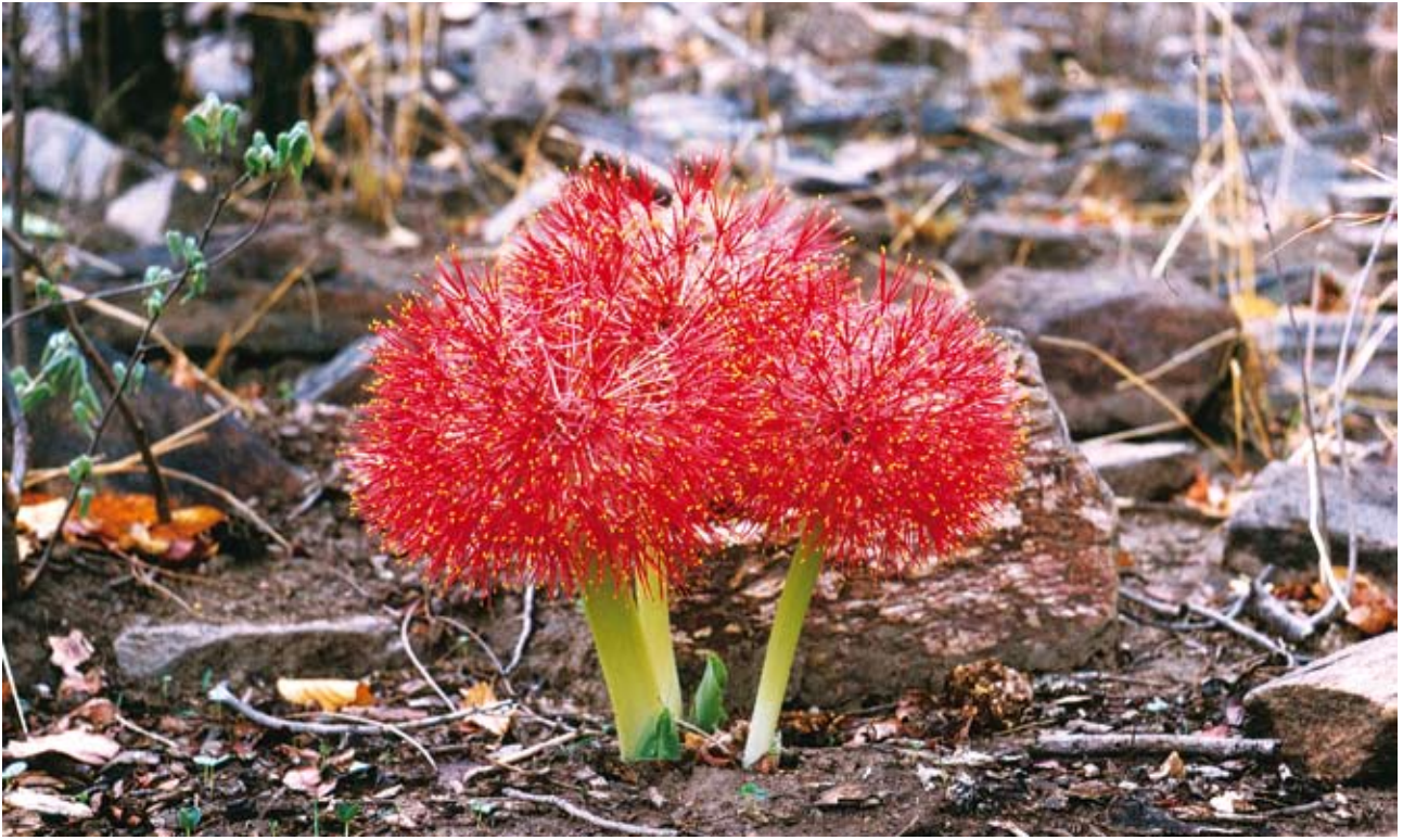
Ryc. 13. Boophane disticha – kwiatostany rozwijające się przed rozwojem liści; grudzień, pora deszczowa.

innych czynników, zwłaszcza okresów suszy, wysokich temperatur wynikających z cech klimatu, ubóstwa gleb w niektóre składniki, a także wpływu na