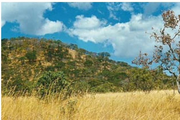
Ryc. 3. Okolice Lusaki, wzgórze „Leopards Hill” pokryte widnym lasem „miombo” i sawanna z wysokimi trawami – widoczne drzewo przeżywające pożary; lipiec – środek pory suchej.

Pożary powstają w przyrodzie z natury, głównie wskutek wyładowań elektrycznych. W strefie sawanowej Afryki występują nieregularnie i są ograniczone faktem, że burze i uderzenia piorunów występują zwykle w porze deszczowej. Na większą skalę działają pożary wzniecane przez ludzi przypadkowo, przez nieuwagę lub celowo. Prawdopodobnie ogromna większość obszarów sawanowych zawdzięcza swe powstanie i utrzymywanie się stałemu wypalaniu. Termin występowania i intensywność ognia decydują o wzajemnym stosunku przestrzennym trawiastej,