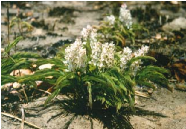
Ryc. 14. Cryptosepalum marawiense – przykład „geoxylic suffrutex” – kwiaty i kępy liści niszczone w czasie pożarów; wrzesień – pod koniec pory suchej.

rośliny spasanja przez zwierzęta tworzące duże stada, co istniało już przed rozwojem pasterstwa, związane z gospodarką człowieka.