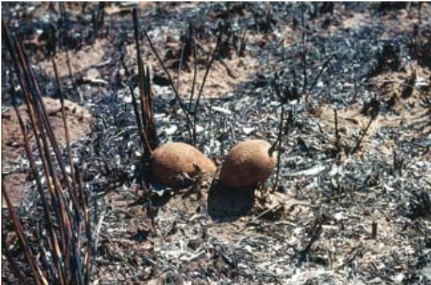
Ryc. 17. Owoce Gardenia subcaulis , odporne na działanie ognia; początek wrzesnia – pora sucha.

może być para: przedstawiona już, maleńka Gardenia subcaulis na spaleniskach i okazały krzew Gardenia