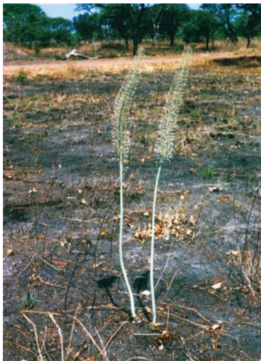
Ryc. 12. Urginea altissima na świeżym spalenisku – pędy wyrastają ze szczytów cebul widocznych na powierzchni gleby; październik, koniec pory suchej.

liaceae) (Ryc. 12) i pięknie kwitnące Boophone disticha (Amaryllidaceae) (Ryc. 13). Cebule tych roślin położone są tuż pod powierzchnią ziemi, powstające w ich obrębie zawiązki pędów znajdują się nieco