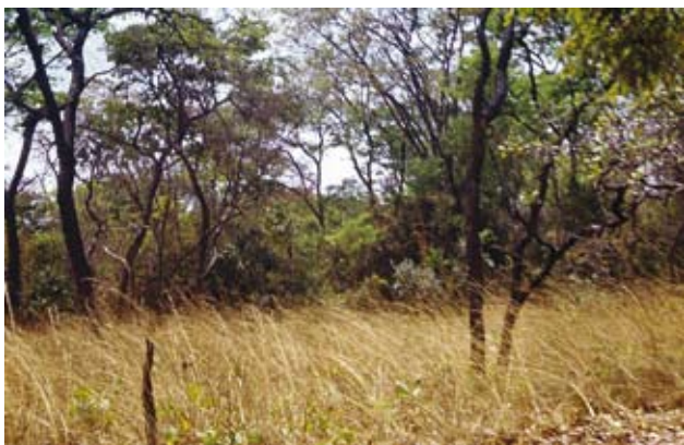
Ryc. 5. Powierzchnie doświadczone koło Ndola. Formacja trawiasta wypalana późno, utrzymująca się na siedlisku lasu „miombo”, widocznego w głębi; wrzesień – pod koniec pory suchej.

Ogień przechodzi przez sawannę zazwyczaj szybko, według niektórych informacji z prędkością 100–300 m na godzinę. Temperatura podnosi się przy tym gwałtownie nawet do kilkuset stopni Celsjusza, ale tylko nad powierzchnią gleby; sama gleba nagrzewa się nieznacznie i do niewielkiej głębokości. Lekki, łagodnie przechodzący ogień (Ryc. 6), częsty na sawannach, może pozostawiać fragmenty roślinności niezniszczone. Nadziemne części gatunków nie drzewiastych spalane są zwykle na wysokości powyżej 1–2 cm. To umożliwia przetrwanie niżej położonych pączków odnawiających, pelzających łodyg, a także nasion i owoców znajdujących się na powierzchni ziemi.