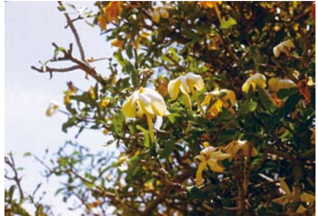
Ryc. 19. Krzewiasta Gardenia jovis-tonantis rosnąca w miejscach nie wypalanych, koło Jeziora Alau w Nigerii. Maj, w tamtym regionie początek pory deszczowej.

związana z terminami wystąpienia ognia, niż z porami roku. Wiele danych wskazuje zatem, że ogień miał szczególne znaczenie w ewolucji roślin sawanowych, w której wyniku rozwinęły się pirofity.