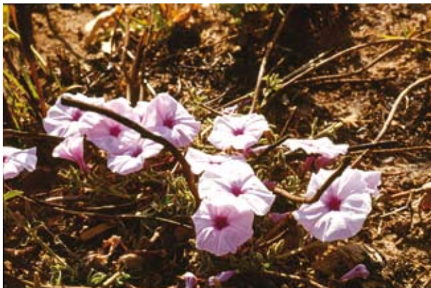
Ryc. 11. Astripomea malvacea kwitnąca tuż przy ziemi; przy braku ognia może tworzyć wzniesione pędy, a nawet być krzewem; wrzesień – druga połowa pory suchej.

niż u hemikryptofitów. W opisywanych warunkach ta grupa roślin reprezentowana jest przez nieliczne gatunki, nawet jeśli się do niej zaliczy niektóre „suffrutices” i zbliżone do hemikryptofitów geofity płytkie. Należą do nich np. Urginea cfr. indica (Li-