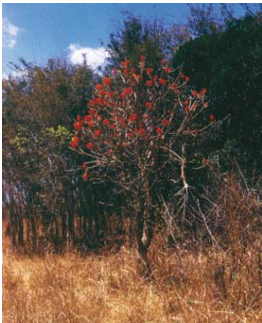
Ryc. 8. Kwitnąca drzewiasta Erythrina tomentosa wśród palonych okosowo traw; wrzesień – pod koniec pory suchej.

Fanerofity czyli jawnopączkowe mają pączki odnawiające powyżej 25 cm nad ziemią; rosną głównie jako krzewy lub drzewa (Ryc. 8). Kora pirofitów należących do tej grupy jest odporna na działanie ognia, a niekiedy odporne są także liście. Niektóre gatunki jak np. Erythrina tomentosa (Fabaceae) zakwitają zwykle po pożarze.