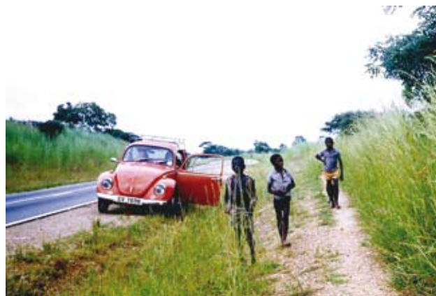
Ryc. 2. Droga przez sawannę (około 100 km na północ od Lusaki); miejscowe dzieci i samochód, którym poruszaliśmy się po Zambii; marzec (koniec pory deszczowej).

Sawanny – formacje roślinne utworzone przez wysokie trawy, z nielicznymi, pojedynczo stojącymi drzewami i krzewami lub bez nich oraz suche lasy (określane nieraz jako sawannowe) występują m.in. w Zambii położonej w południowo-wschodniej Afryce, skąd pochodzą podane tutaj obserwacje. Autorka miała możliwość przebywania w tym kraju dzięki podjęciu przez męża Jana Kornasia obowiązków profesora w uniwersytecie w stolicy, Lusace. Działo się to niespełna 10 lat po przekształceniu kolonii angielskiej – Rodezji Północnej w niepodległe państwo. Uczelnia działała dobrze, zatrudniała wielu wykładowców z zagranicy. Było spokojnie i bezpiecznie. Główne drogi pozostawały w dobrym stanie, można było nocować pod namiotem w miejscach campingo-