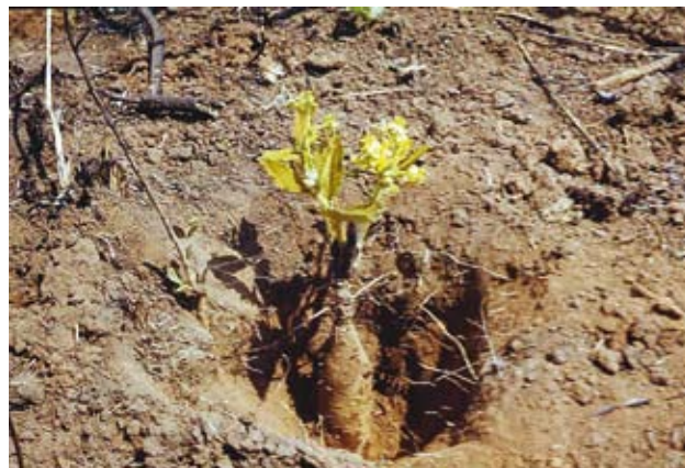
Ryc. 10. Triumfetta heliocarpa , widoczne miejsce wyrastania pędów nadziemnych i mocno zgrubiały korzeń; wrzesień – druga połowa pory suchej.

fitów. Z roślin dwuliściennych do omawianej grupy należą np. Triumfetta heliocarpa (Tiliaceae) (Ryc. 10) o wyraźnie zgrubiałym korzeniu i Astripomea malvacea (Convolvulaceae) (Ryc. 11), tworząca kłącza blisko powierzchni gleby.