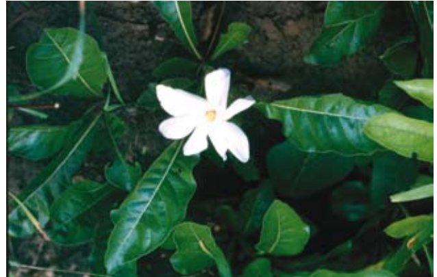
Ryc. 18. Gardenia subcaulis – kwiaty i liście rośliny w porze deszczowej.

mające podziemny pień i jedynie kępę liści lub niskich pędów nad ziemią, wyrastają jako drzewo wówczas, gdy nie są narażone na pożary. Na uwagę zasługuje także fakt, iż rytmika rozwoju pirofitów jest bardziej