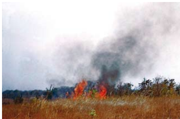
Ryc. 6. Pożar na trawiastej sawannie koło Lusaki; wrzesień – pod koniec pory suchej.

Zasięg i intensywność pożaru zależą od prędkości, a zarazem siły wiatru oraz od charakteru i ilości suchej biomasy. Do łatwopalnych należą zwłaszcza trawy, dominujące w formacjach sawanowych, a także na