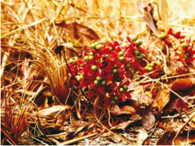
Ryc. 16. Ochna angustifolia („geoxylic suffrutex”) z owocami, na spalenisku. Do tego rodzaju należą też krzewy i drzewa; wrzesień, pod koniec pory suchej.

Interesujący jest fakt istnienia gatunków spokrewnionych, należących do tego samego rodzaju, z których jedne są pirofitami, najczęściej z grupy suffrutices, a inne mają zupełnie odmienną postać. Przykładem