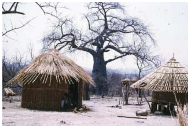
Ryc. 4. Wieś Changa w okolicy rzeki Zambezi – tradycyjne domy, baobab i naga gleba, chroniąca przed pożarem; pora sucha.

Optymalne warunki dla powstawania pożarów występują przy opadach 250–1500 mm na rok i okresie suszy trwającym 5–7 miesięcy w roku. Tak jest na omawianych obszarach. Suma roczna opadów w rejonie Lusaki wynosi około 800 mm (z dużymi odchyleniami w poszczególnych latach), a od kwietnia do października niemal zupełnie brak deszczu. Temperatura pod koniec pory suchej dochodzi do ponad 37°C. Biomasa wielu roślin, zwłaszcza okazałych traw, wyprodukowana w porze deszczowej wysycha po jej zakończeniu i staje się łatwopalna. Mieszkańcy położonych na sawannach wioski zabezpieczają się przed ich spalaniem przez utrzymywanie wśród domów nagej ziemi (Ryc. 4).