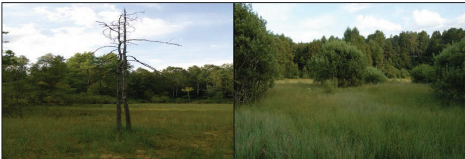
Photo 1. The research site no.1 (on the left). The research site no.2 (on the right)

Fotografia 1. Powierzchnia badawcza nr 1 (po lewej). Powierzchnia badawcza nr 2 (po prawej)