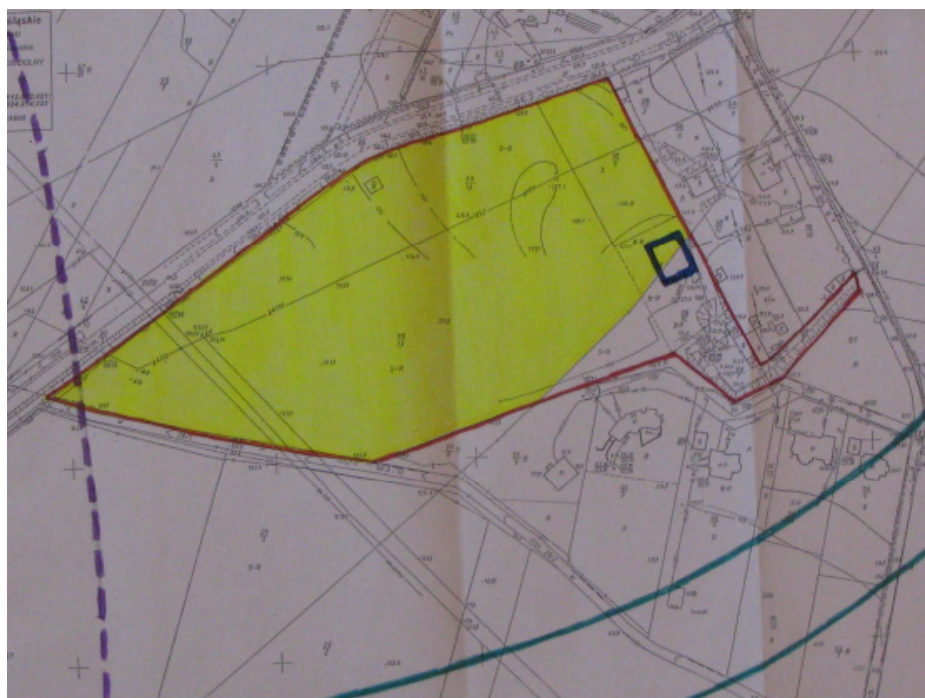
Rysunek 2. Usytuowanie wywłaszczanej części gospodarstwa sadowniczego. Pole żółte obszar objęty decyzją wywłaszczeniową. Linie: czerwona – ogrodzenie nieruchomości, fioletowa przerywana – strefa budowanej autostrady, zielona – granice nie zrealizowanej, projektowanej w MPZP drogi publicznej, ciemnoniebieska - zarys budynku chłodni owoców

Oprócz wymienionych obiektów gospodarstwo wyposażono w szereg urządzeń i instalacji, w tym: 2 nawadniające i 1 awaryjny zbiornik wodny, 4 studnie głębinowe, system odprowadzania wód po myciu chłodni, pompy, maszt reklamowy, konstrukcje sadownicze, elementy małej architektury.