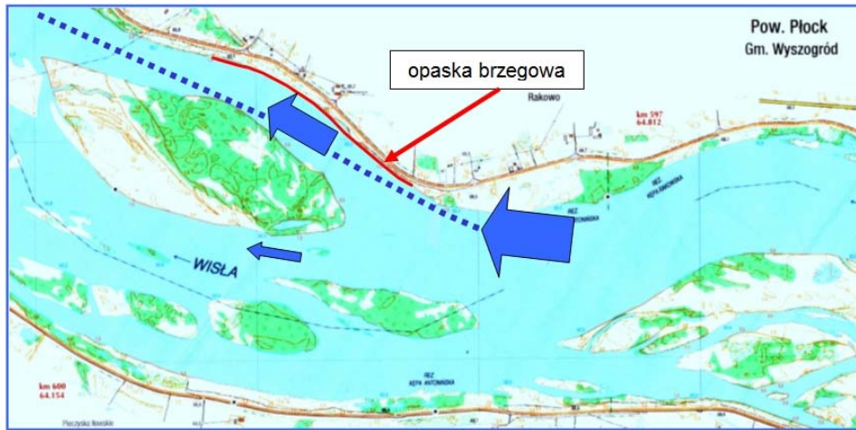
Rysunek 3. Koncepcja realizowana w wyniku postanowienia sądu Figure 3 . The technical solutions implemented as a result of legal proceedings

Efektym tego będzie znaczna poprawa warunków przepływu w bocznym ramieniu rzeki. Może to skutkować intensyfikacją procesów erozji dennej i brzegowej w bocznym ramieniu, a w nieodległej perspektywie przekształcenie go w główne koryto Wisły. Spowoduje to ograniczenie aktywności morfodynamicznej w centralnej części koryta oraz przyspieszenie procesu załadowania płytszych fragmentów centralnej części koryta. Zaproponowane działania spowodują wyprostowanie rzeki na długości 2–3 km. W efekcie na kilkukilometrowym odcinku Wisła zostanie uregulowana według skrajnie technicznych zasad (wyprostowanie koryta), przypominających rozwiązania w regulacji rzek, stosowane w przeszłości i bardzo krytycznie oceniane przez przyrodników. Podkreślić należy, że rozwiązanie to zostało wymuszone przez przyrodników. Koncentracja przepływu wody w bocznym – prawym ramieniu spowoduje zmniejszenie aktywności morfo-dynamicznej w centralnej części koryta, co będzie skutkowało stabilizacją morfologicznych struktur korytowych – wysp, odsypisk, ławic piaskowych. Będzie to zjawisko zdecydowanie niekorzystne dla rezerwatu, gdyż podstawą jego funkcjonowania jest duża dynamika zmian tych struktur w korycie rzeki. Oczekiwać należy także niekorzystnych oddziaływań wtórnych – zmian krajobrazu w centralnej części koryta.