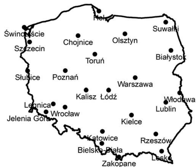
Rycina 1. Stacje meteorologiczne wykorzystane w pracy Figure 1. Meteorological stations used in this work