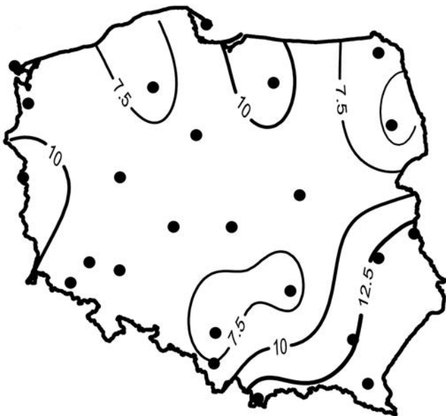
Rycina 4. Rozkład przestrzenny współczynnika trendu liniowego opadów optymalnych P_{opt} (mm/dekadę) w okresie 1951–2015

W Polsce południowej i południowo-wschodniej odnotowano tendencję do wzrostu suchości klimatu, a zmiany w opadach krytycznych mają istotne znaczenie w kształtowaniu zasobów wodnych. Na przykład najwyższy wzrost opadów krytycznych na Wyżynie Lubelskiej prowadzi do coraz mniejszej różnicy pomiędzy P_a i P_{krt} tj. wartości deficytu opadów atmosferycznych (ryc. 6). Zatem zachodzące pod wpływem wzrostu salda promieniowania zmiany w warunkach higroklimatycznych oznaczają, że obserwowany trend w opadach atmosferycznych zbliża się do granicy wyznaczającej strefę klimatu suchego ( RIA > 1 ), utrudniającej wegetację roślinności leśnej. Ujemna tendencja w różnicy pomiędzy opadami atmosferycznymi a opadami krytycznymi odnotowana została na wielu stacjach meteorologicznych centralnej Polski oraz Górnego i Dolnego Śląska. Wyniki potwierdzają pogorszenie się warunków higrycznych w rejonie, który w świetle wielu opracowań wyróżnia się ujemnym bilansem wodnym (Rojek, Wiercioch 1995; Rojek 2001; Łabędzki et al. 2012) oraz ujemną tendencją opadów rocznych (Zawora, Ziernicka 2003). Natomiast na obszarze północno-wschodniej Polski, gdzie wyniki badań wskazały zmniejszenie się wskaźnika suchości klimatu, mamy także do czynienia z dodatnim trendem deficytu opadów atmosferycznych. Wzrost różnic P_a - P_{krt} oznacza warunki, w których występujący opad pokrywa zapotrzebowanie na ewapotranspirację potencjalną oraz stanowi również zasób dla wegetacji roślinności.