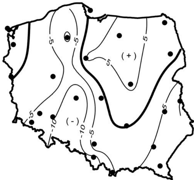
Rycina 6. Rozkład przestrzenny współczynnika trendu liniowego deficytu opadów D (mm/dekadę) w okresie 1951–2015

Zmiany klimatu, poza zmianą temperatury i opadów atmosferycznych, to również wzrost koncentracji dwutlenku węgla w atmosferze. Prowadzi to do wzrostu intensywności