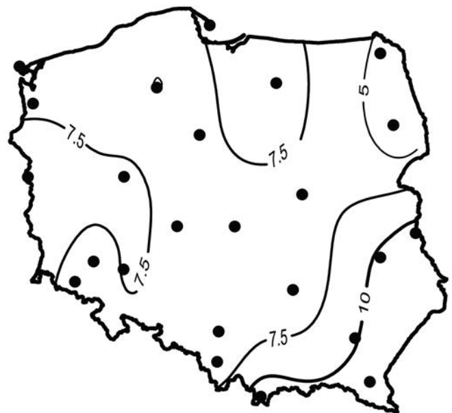
Rycina 5. Rozkład przestrzenny współczynnika trendu liniowego opadów krytycznych P_{krt} (mm/dekadę) w okresie 1951–2015

Figure 4. The spatial distribution of trend coefficient of the optimum values of annual precipitation P_{opt} (mm/decade) during the years 1951–2015