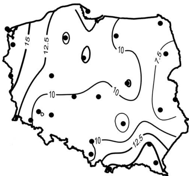
Rycina 7. Rozkład przestrzenny współczynnika trendu liniowego wskaźnika CVP (na dekadę) w okresie 1951–2015

Figure 6. The spatial distribution of trend coefficient of the annual deficits of observed precipitation totals D (mm/decade) during the years 1951–2015