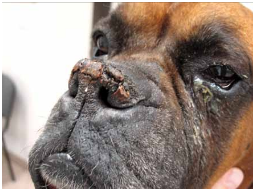
Ryc. 4. Hiperkeratoza płytki nosowej. Widoczny przerost naskórka i gromadzenie keratyny

Chorobę można rozpoznać również, podobnie jak inne choroby pęcherzowe, za pomocą immunofluorescencji.