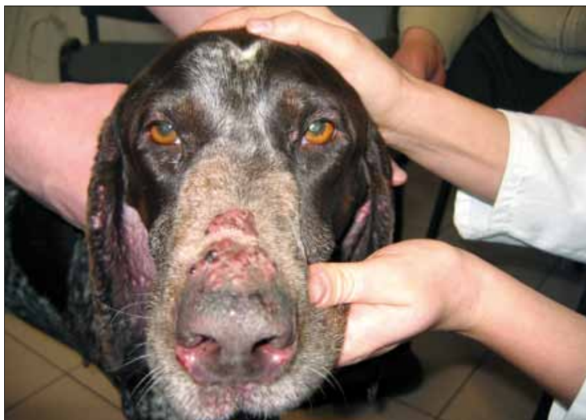
Ryc. 2. Pemfigoid błon śluzowych. Na płytce nosowej widoczne jest odbarwienie oraz rumień i nadżerki. Na grzbiecie nosa widoczne są pęcherze i strupy

Jest to bardzo rzadko spotykana choroba autoimmunologiczna. W jej przypadku dochodzi do powstawania autoprzeciwciał skierowanych przeciwko kolagenowi XVII i lamininie 5. Choroba u psów i kotów z reguły występuje u osobników dorosłych, jedynie sporadycznie rozpoznaje się