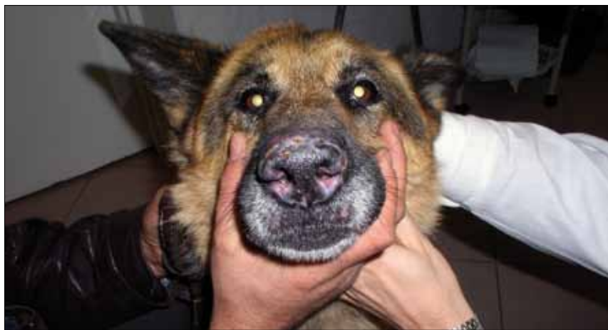
Ryc. 1. Krążkowy toczeń rumieniowaty u psa. Widoczne odbarwienia płytki nosowej oraz rumień, nadżerki i strupy