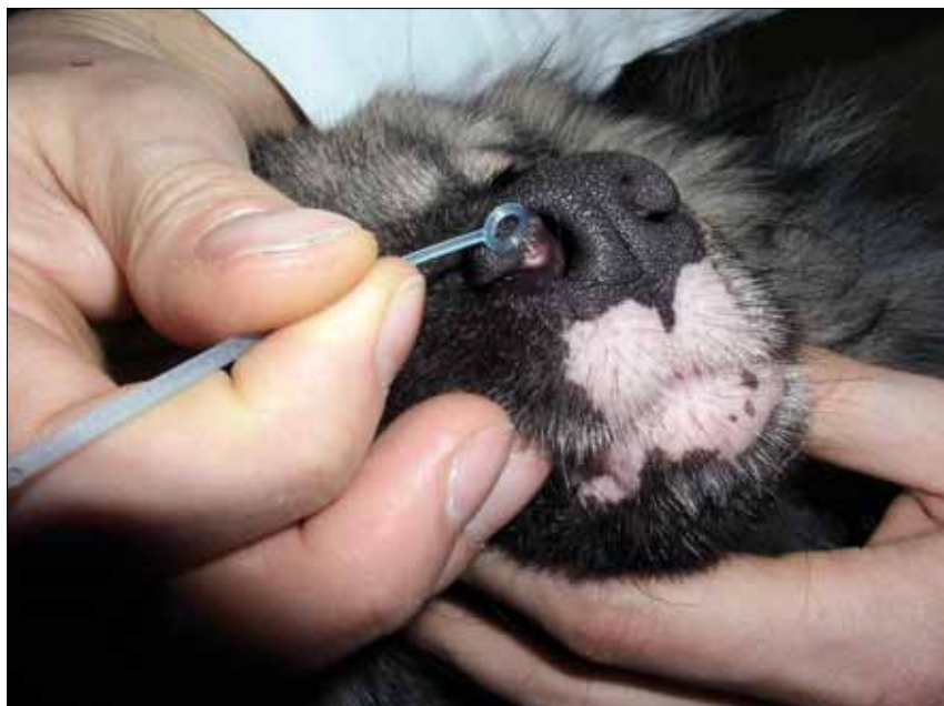
Ryc. 5. Bielactwo u psa. Odbarwienie nozdrzy oraz skóry poniżej płytki nosowej

Choroba ta, podobnie jak dwie opisane poprzednio jednostki chorobowe, uważana jest za mającą podłoże genetyczne. Jej przypadki rozpoznawane były u takich ras psów, jak: owczarki niemieckie, owczarki belgijskie terwuren, nowofundlandy, owczarki collie, rottweilery, doberman, sznauclery olbrzymie, owczarki staroangielskie, jamniki i pinczery (1, 3, 4, 31). Stwierdzano ją również u kotów, a opisywane przypadki dotyczyły kotów syjamskich (1, 33, 34, 35). Patogeneza choroby nie jest w pełni wyjaśniona, istnieje kilka teorii tłumaczących mechanizm jej rozwoju. Przypuszcza się, że choroba może mieć podłoże autoimmunologiczne i w takich przypadkach dochodzi do powstawania przeciwciał przeciwko melanocytom (36). Tego typu mechanizm autoimmunologiczny najbardziej prawdopodobny jest w przypadku owczarków belgijskich terwuren, ponieważ u tej rasy stwierdzono występowanie takich przeciwciał (32, 37). Kolejną teorią jest ta, że choroba ma podłoże autotoksyczne i wynika z tego, że melanocyty są bardziej wrażliwe na prekursor melaniny – dopachrom (1). Sugeruje się również, że choroba może mieć podłoże neurogenne i związana jest z uszkodzeniem nerwów lub też, że za jej rozwój są odpowiedzialne zakażenia wirusowe. W przypadku kotów uważa się, że dziedziczenie choroby ma charakter wielogenowy i związane jest z autosomalnym genem dominującym (33). Istnieje ją również przypuszczenia, że podłożem