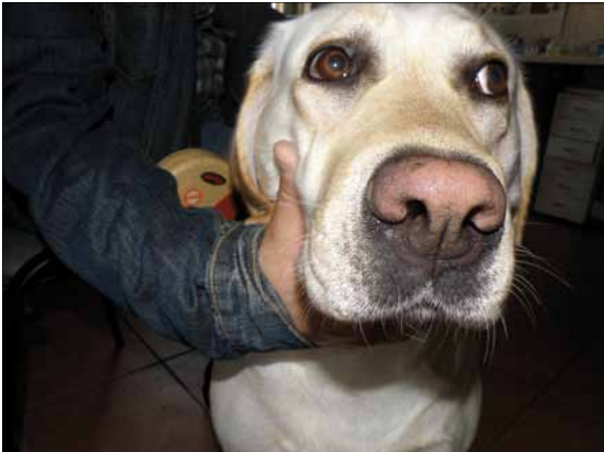
Ryc. 7. Idiopatyczne odbarwienie płytki nosowej u labradora. Widoczna zmiana barwy na kolor brązowy

bielactwa. W przypadku gdy utrata barwnika nie jest całkowita, można mówić o hipopigmentacji płytki nosowej. Choroba rozpoznawana jest częściej u pewnych ras, jak labrador i golden retriever, syberian husky, samojed, owczarek niemiecki, pudel, doberman, owczarek afgański, seter irlandzki i pointer (1). Choroba ma charakter postępujący, początkowo widoczna jest zmiana barwy płytki nosowej na brązową (ryc. 7), a następnie białą. Odbarwienie ma zwykle charakter sezonowy – do utraty pigmentu dochodzi w miesiącach zimowych, natomiast w okresie letnim nos staje się ciemniejszy. Płytką nosową nie jest jedyną okolicą ciała, gdzie mogą pojawiać się objawy. Może również dochodzić do utraty pigmentu na wargach, opuszkach palców i powiekach. Odbarwieniu mogą ulegać też pazury, a nawet włosy. Do tej pory brak opracowanego leczenia. Choroba ma jedynie charakter defektu kosmetycznego.