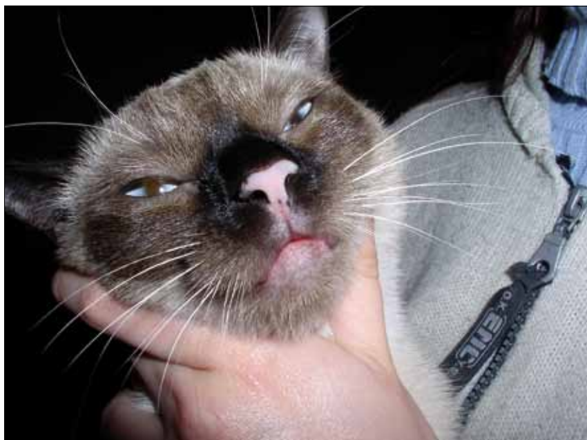
Ryc. 6. Bielactwo u kota. Odbarwienie płytki nosowej

choroby mogą być zaburzenia neurochemiczne, które prowadzą do hamowania procesu melanogenezy (33).