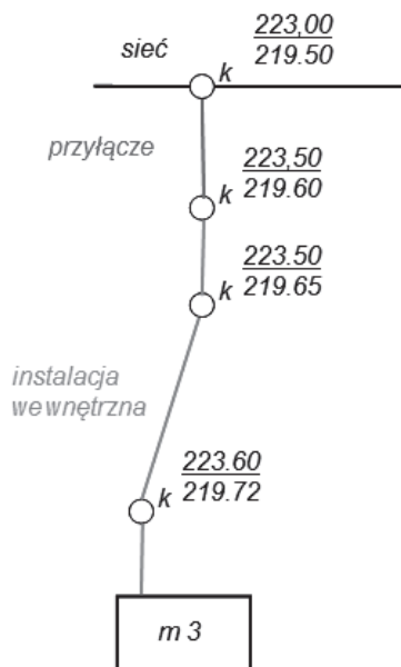
Rysunek 2. Przyłącze kanalizacyjne zgodnie z definicją Figure 2. The sewer lateral as defined