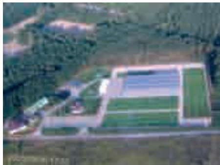
Fot. 1. Szkołka „Skierdy” z lotu ptaka