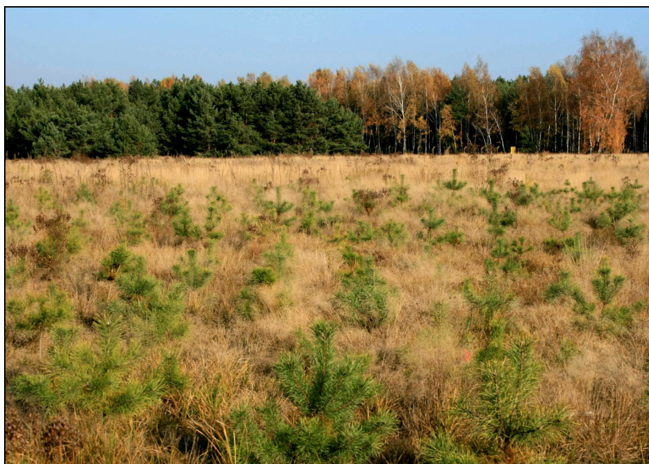
Fotografia 1. Zalesiony teren popoligonowy Bydgoszcz-Jachcice jesienią 2009 r.

Opis doświadczenia. Badania przeprowadzono w roku 2009 na terenie byłego poligonu wojskowego w Bydgoszczy-Jachcicach (Leśnictwo Jagodowo, Nadleśnictwo Żołędowo), w uprawach sosny zwyczajnej ( Pinus sylvestris L) założonych wiosną 2008 r. na potencjalnym siedlisku boru świeżego (fot. 1).