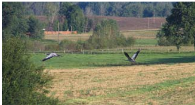
Ryc. 6. Lecą żurawie. Mrągowo.

New7Wonders na Nowe 7 Cudów Natury. Jesteśmy w gronie 28 najpiękniejszych miejsc na świecie, jako jedyna kandydatura w swojej kategorii – krajobrazy i formacje polodowcowe . Dwa dni przed zakoń-