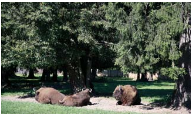
Ryc. 1 Żubry w Białowieży.

obiekту Dziedzictwa Światowego UNESCO. Symbolem parku jest żubr, największe zwierzę kontynentu (ryc. 1). W 1973 roku stado żubrów zostało również wprowadzone do Puszczy Knyszyńskiej.