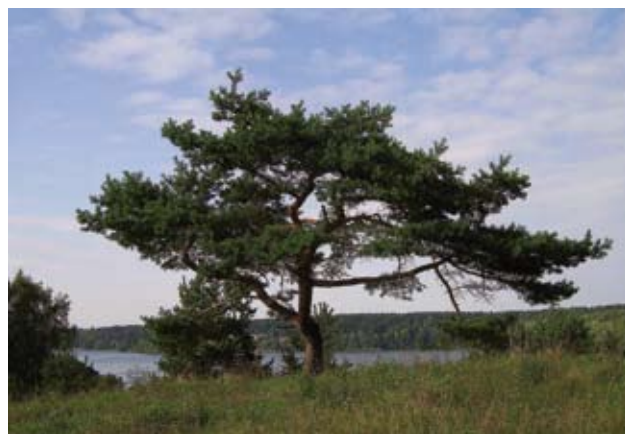
Ryc. 8. Sosna na wzgórzu nad jez. Czos. Mrągowo.

się zakończy. Od 21 lipca 2009 roku można głosować na nowej stronie fundacji: http://www.new7wonders.com/en/ .