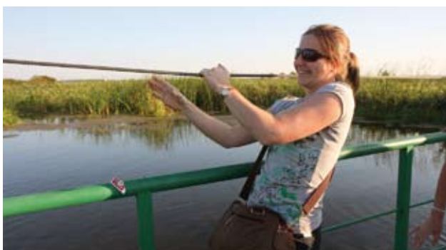
Ryc. 2. Platforma pontonowa nad Narwią.

Na konferencji naukowej z okazji jubileuszu ochrony Puszczy Białowieskiej, Minister Środowiska wyraził nadzieję, że uzyskana zostanie zgoda gmin puszczańskich na trzykrotne powiększenie obszaru Parku Narodowego. Białowieski Program Rozwoju przewiduje poszerzenie granic Parku Narodowego do 30–35 tys. ha. Konieczne jest jednak wyrażenie na to zgody gmin; Hajnówka, Białowieża i Narewka. Mieszkańcy tych terenów dostali zapewnienie Ministra o bezpłatnym wstępie do Parku, możliwości zbioru (poza rezerwatami przyrody) jagód, grzybów i ziół oraz o udostępnieniu im w pierwszej kolejności drewna pochodzącego z prac renaturyzacyjnych.