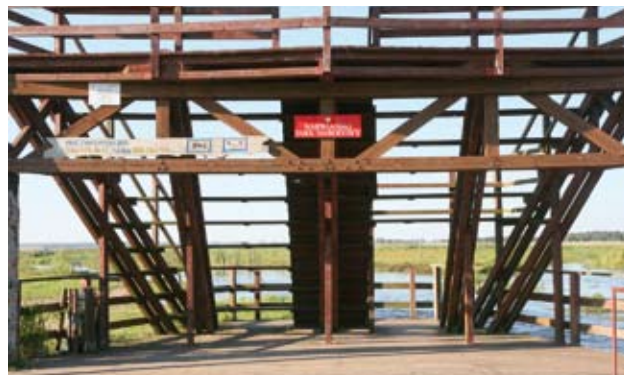
Ryc. 3. Wieża widokowa nad Narwią.

pomostów postawionych ponad rzeką. Na pięciu odcinkach łączą się one ze sobą ruchomymi platformami na pontonach. Platformy są tak skonstruowane, że będący na nich ludzie mogą je przeciągać za pomocą