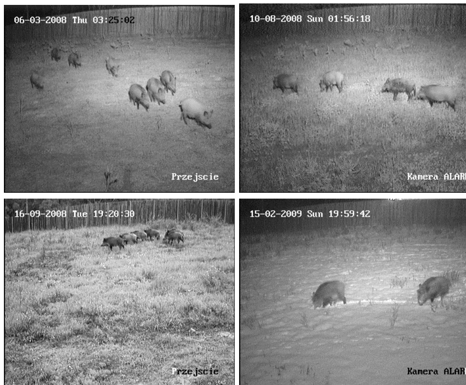
Fotografia 2. Przykładowe sekwencje filmowe migrujących dzików przejściem dla zwierząt nad drogą krajową nr 5 (uwaga data i godzina migracji widoczna na zdjęciach)